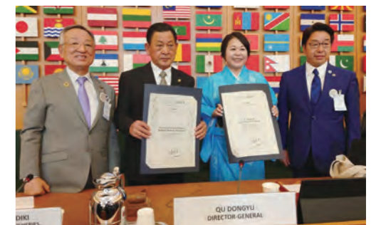
イタリア・ローマで開催された世界農業遺産認定証授与式