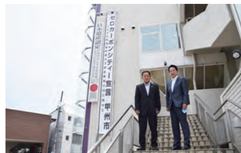
やまなし「ゼロカーボンシティ」を共同宣言