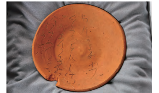
塩山下於曽地内のケカチ遺跡より「和歌刻書土器」が出土