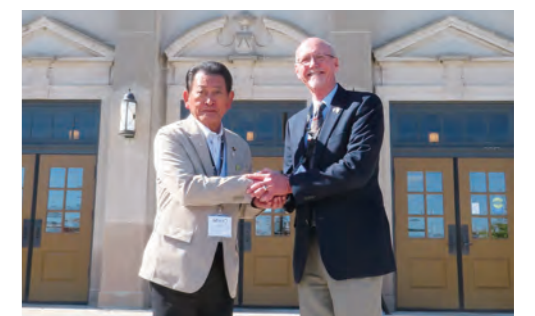
友好親善都市提携30周年を記念し「アメリカ合衆国エイムズ市」を訪問