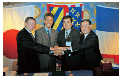
フランス共和国ボヌ市姉妹都市協定締結

2006年 4月 (平成18年) ・鈴宮寮完成 ・神奈川県大和市と「友好都市協定」締結 8月 ・子どもサミット開催／甲州市子ども憲章制定 10月 ・フランス共和国ボヌ市と「姉妹都市協定」締結 ・千葉県富津市と「友好都市及び災害時相互 援助協定」締結 11月 ・市制施行1周年記念式典挙行 ・甲州市市民憲章、市の「木」「花」「鳥」、 イメージソング制定 12月 ・景徳院「武田勝頼の墓」から経石が出土 ・甲州市空き家情報バンク制度開始