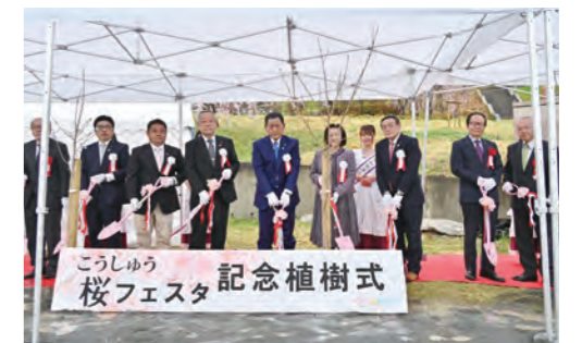
こうしゅう桜フェスタを初開催 塩山ふれあいの森総合公園内に50本の桜の木の植樹を実施