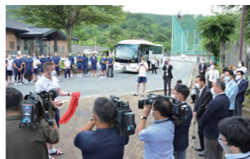
東京2020オリンピックフランスハンドボールチーム 事前キャンプを実施