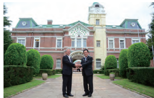
日本遺産に「日本ワイン140年史—国産ブドウで醸造する和文化的結晶—」認定