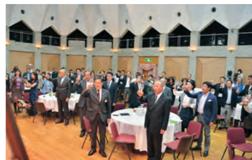
甲州ワインの日を祝う記念セミナー開催