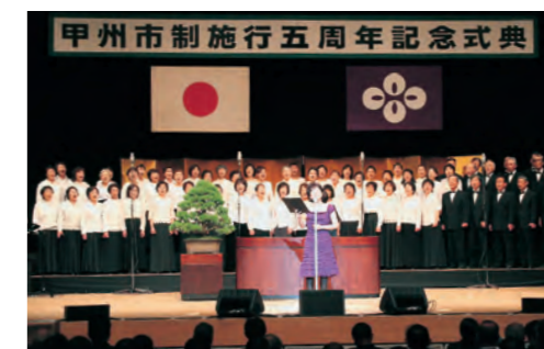
市民の歌 みのりの風、虹の丘(2010.11) 市制施行5周年を記念して 歌手の森山良子さんが作曲を手がけた市民の歌。

2011年 1月 (平成23年) ・「企業の森(甲州市オルピスの森) 森林整備協定」締結 3月 ・近代産業遺産「宮光園」オープン 4月 ・子ども医療費の窓口無料化拡大 7月 ・甲州市地域おこし協力隊事業開始 9月 ・甲州市原産地呼称ワイン認証制度 第1回認証書交付 ・東京都中野区と「災害時における相互応援に 関する協定」締結 10月 ・甲州市「確かな学力」育成プロジェクト開始 11月 ・デマンドバス(塩山地域)実証運行開始