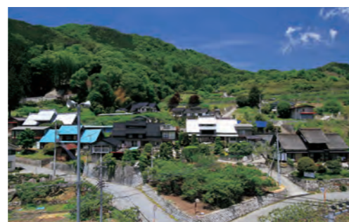
甲州市塩山下小田原上条重要伝統的建造物群保存地区に選定