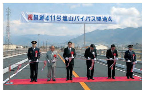
国道411号塩山バイパス開通

2008年 3月 (平成20年) ・第1次甲州市総合計画策定 ・ふれあいの森総合公園「フルーツパラダイス」オープン ・国道411号塩山バイパス開通 4月 ・フルーツライン(甲州市域)全面供用開始 5月 ・峡東地域広域水道企業団 ・柚口浄水場水道用水供給開始 12月 ・甲州市原産地呼称ワイン認証条例制定