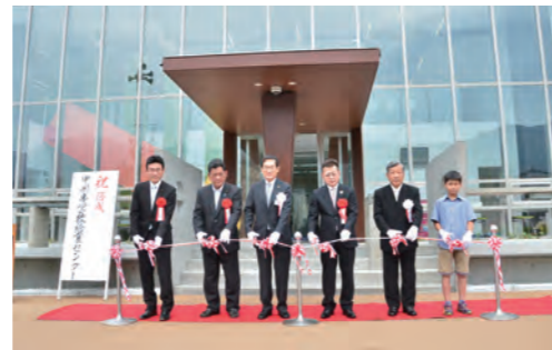
甲州市学校給食センター落成式