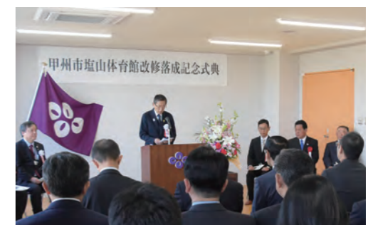
甲州市塩山体育館改修落成記念式典