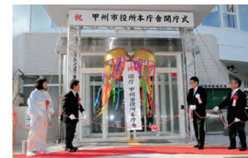
甲州市役所新本庁舎完成

2010年 3月 (平成22年) ・甚六桜公園「さくら橋」完成 ・ぱきぱきマンの歌(甲州市食育の歌)発表 7月 ・甲州市役所 新本庁舎開庁式 10月 ・第1回甲州フルーツマラソン大会開催 11月 ・市制施行5周年記念式典挙行 ・市民の歌「みのりの風 虹の丘」制定・披露