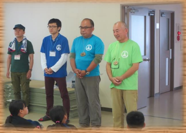
運営スタッフ・参加者で相互にあいさつ