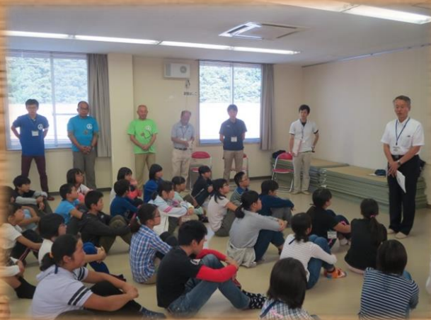
保坂教育長あいさつ