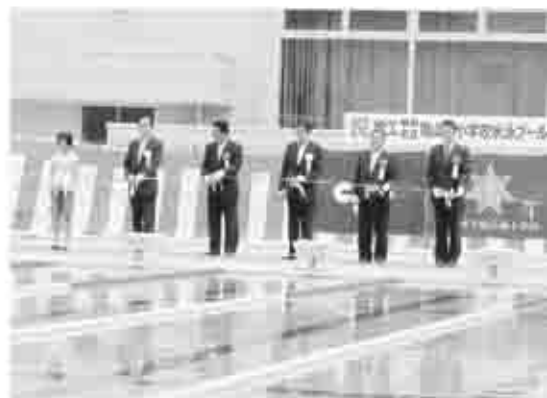
子どもたちが新しいプールを前に、笑顔が水面に浮かんでいました

6月8日（木）の竣工式には、完成を祝い多くの関係者が参加する中、テープカットが行われ祝いました。田辺市長は「このようすばらしいプールが完成しました。子どもたちが、このプールを活用して心と体を鍛え、たくましく育ってください」とあいさつをされました。