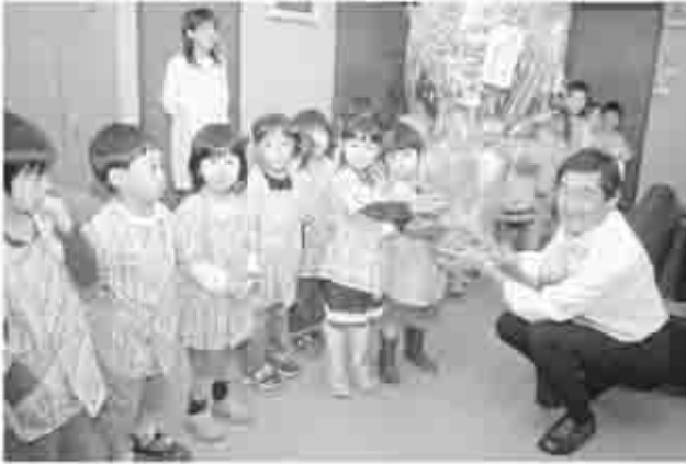
次代を担う子どもたちが、市役所に訪れた。かわいい笑顔で、みんな元気よくあいさつできました。

ちびっこたちは、田辺市長へ「いつもありがとうございます。これからもお仕事がんばってください」とみんな元気よくあいさつをしました。また、市役所の中を見学もしました。