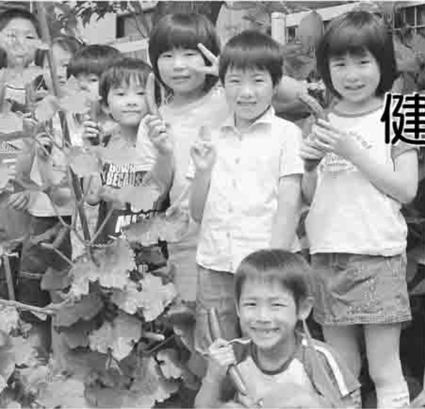
植物を育て、自分自身の成長につなげて欲しい ＝松里小学校では野菜を栽培し、収穫を体験している＝