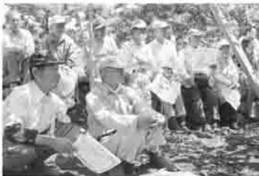
熱心に聞き入る農家の皆さん =6月1日、松里地区のぶどう棚で=

長い時間をかけて親から子に、その 地域や家で代々受け継がれてきた料 理だから残したいね。