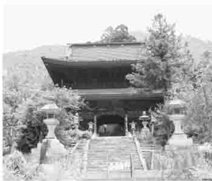
石段が続く大善寺山門（県指定文化財） 上り切ったところに国宝本堂が建つ