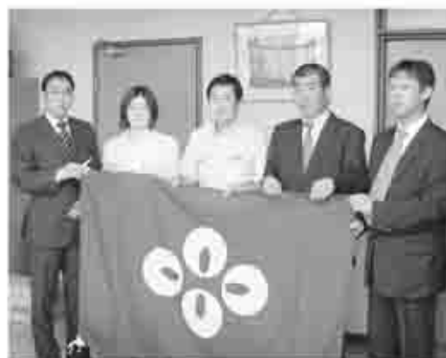
田辺市長から市旗が手渡された