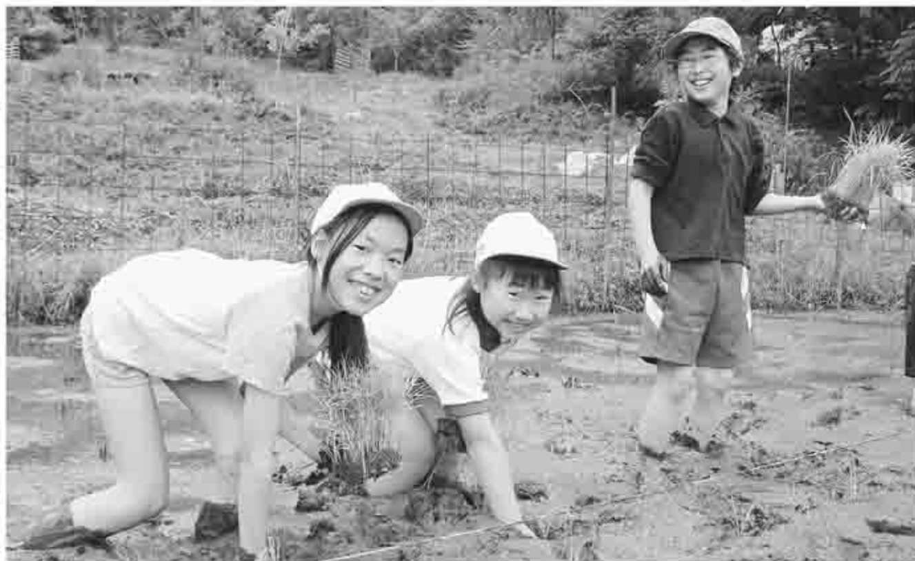
普段何気なく食する「お米」 田植え学習は、「食」への関心をより高める