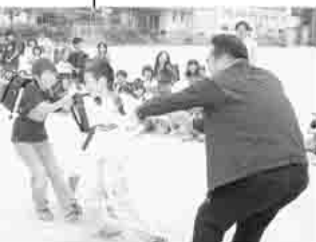
訓練で大きな声で「たすけてえ〜!」と叫ぶ児童