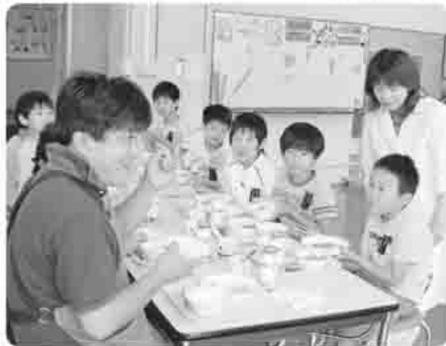
大和小学校の給食風景。全校児童みんな一緒に食べます。大和地 域の農家の協力を得て、地元の食材を使い、献立内容も和食や洋食、 そして昔ながらのメニューも取り入れている。

しっかり食べないと骨が 弱っちゃうよ。大人になっ てから骨が折れやすくなる かもしれないよ。