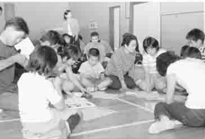
親子で通学路など危険な場所を話し合いながら、シールを貼り付け「安全マップ」を作成

また、この日、塩山北小学校では地元の消防団による「防災・安全教室」も行われました。放水訓練の様子を見学し、防災に対する準備や心がけなど消防団のみなさんと一緒に考えました。子どもたちは、間近に見る消防車や放水する団員の真剣な姿に目を輝かせながら見ていました。授業参観で「命」をテーマに安全教育、防災などあらためて親子で触れ合いながら、命