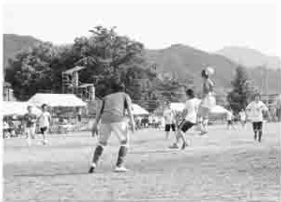
サッカーで各国の交流の輪が広がった「ワールドコップ」

4年前からワールドコップ実行委員会が、県内で暮らす外国の方との交流を図ろうと開かれ、優勝チームには金色の大きなコップが贈られます。5月28日（日）に勝沼中央公園グラウンドでブラジルやペルー、中国など13カ国、6チームが参加しました。各国それぞれ白熱したゲームとなり、国際色豊かな応援風景も見られました。