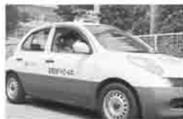
児童の安全確保へ向け、2台の青色パトロール車が市内を巡回

甲州市では昨年からは、青色回転灯を装着した青色パトロールカーが、市内(塩山地域)を巡回しています。