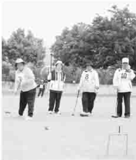
市内それぞれのチームが熱戦を繰り広げた

この大会の結果、上位3位までのチームは県老人クラブ連合会ゲートボール大会に出場します。