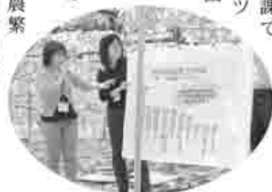
ぶどう棚の下で保健師による、「ミニ健康教室」

ぶどう棚の下で 『ミニ健康教室』 市健康増進課で は、JAフルーツ 山梨と連携を図 り、ぶどうや 桃の栽培講習 会場に保健師 が出向き、「ミ ニ健康教室」を 行っています。 農家の方は農繁 期となり、つい自分自身 の健康に無理をしがちな時期です。ミ ニ健康教室は、農業栽培講習会の前の 時間を利用して保健師から総合健診の 受診率が低いことや、病気の早期発見 と予防などの話しをします。 今後も健康増進課では、