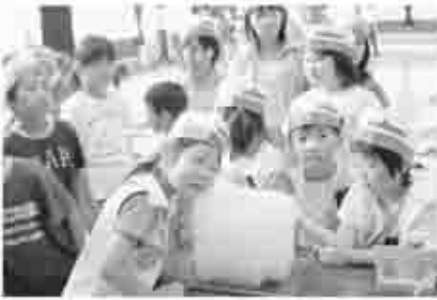
南極の氷に触れる児童。不思議な氷を肌で感じる

6月23日(金)に大和小学校で自衛隊山梨地方連絡部による南極の氷を触れる体験学習が行われました。これは、海上自衛隊の南極観測船「しらせ」が昭和基地近くの冰山から切り出したものです。氷の中には数万年前の空気を含んだ気泡が含まれ、耳に氷を近づけたこともたちは「普通の氷とは、何か違う。空気はじける音がしている」と感動したようでした。