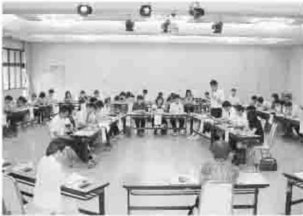
7月11日に「甲州市子ども憲章(子どもサミット)策定会議」が行われた。将来を担う子どもたちの声を市政に生かしたい。

市では、有害獣防護策設置事業に取り組んでいる。また、個々の農園の有害鳥獣から農作物への被害を防止するための補助金交付事業も行っている。