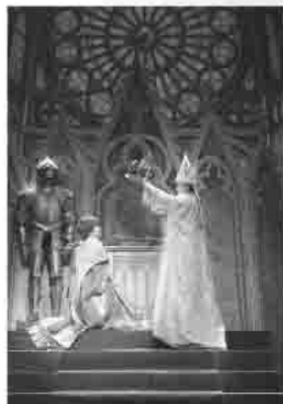
前回公演より