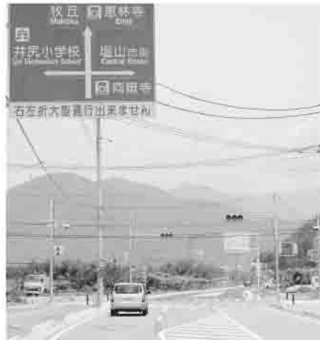
市道上井尻30号線は延長360mが6月20日から供用開始となった。

市道上塩後25号線については、塩後跨線橋北の交差点から東山梨合同庁舎までの間について、地権者のご理解をいた