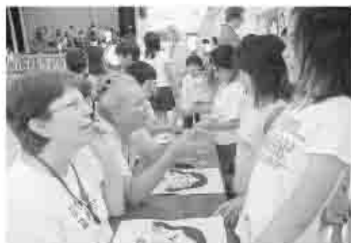
井尻小学校では、「国際理解集会」として、日本の様々な遊びを通して、児童と交流が深められました。

甘草屋敷の前で記念写真。日本の旧家を目の前に感動の様子。屋敷内では「抹茶」を味わいながら、日本の歴史や文化を肌で感じました。訪問団にとって、甲州市での市民との交流は、かけがえのない思い出となったことでしょう。