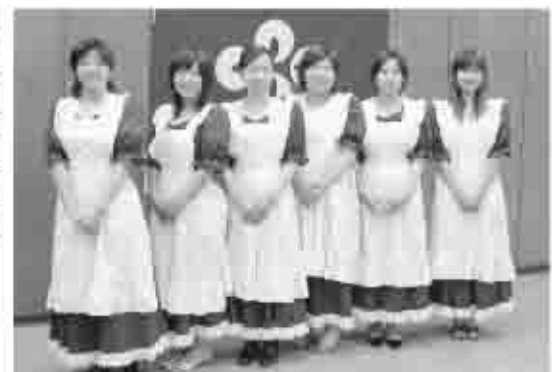
ワインレッドのドレスに白いエプロンの衣装を身につけ、イベントや観光キャンペーンで甲州市をPR