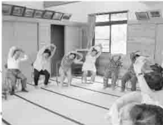
地域の皆さんが楽しく続けられる活動に取り組んでいる大和愛育班

健康で自立した生活を送るためには、腰が丈夫でなくてはなりません。これからも地区の皆さんと協力し合い、教室を続けていききたいと思えます。