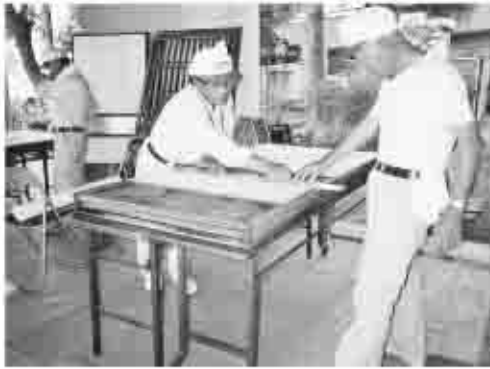
作業に汗を流す、塩山建設組合員

組合員約30人が参加し、グループに分かれ、15軒のお宅を訪問して、障子の張り替えなどに汗を流しました。一人暮らしの老人の方は「自分では、なかなかできないことですので非常に助かりました」と笑顔で話してくれました。