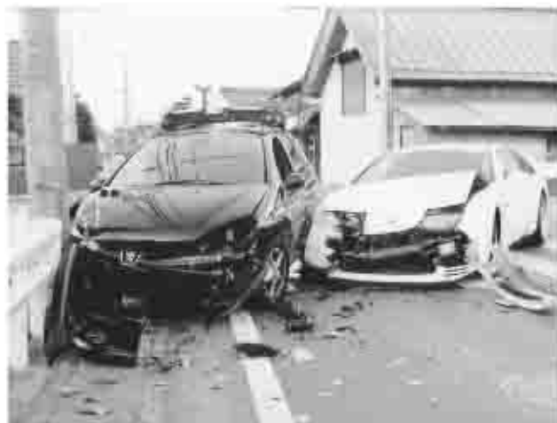
悲惨な事故が増加している

高齢者が犠牲となる事故が県下で12件。全体の45%を占めています。また、歩行中の死者10人のうち、5人が高齢者となっており、当県の交通事故死者の増加率は全国的にも極めて高くなっています。