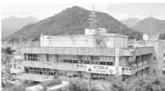
甲州市本庁舎は昭和41年に竣工され、築40年が経過している。診断結果により、早急に大規模な補強、もしくは改築が必要とされている。

して参りました大月都留広域事務組合への期限が本年4月30日となっております。5月1日からは民間施設である埼玉県環境整備センター内の「彩の国資源循環工場」熱分解ガス化改質施設にごみ処理委託をしています。