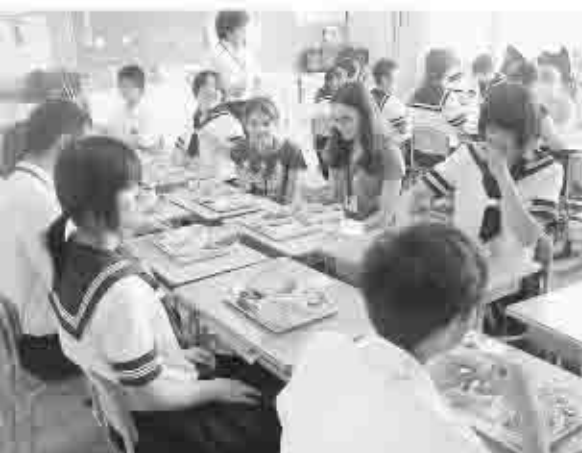
塩山北中学校で授業風景を見たり、生徒と一緒に琴の演奏を体験。また、日本の給食も味わいました。慣れない箸に苦戦・・・

アメリカ合衆国アイオワ州エイムズ市と旧塩山市は、教育スポーツ、文化など様々な分野で相互交流を続け、平成5年9月20日に国際友好都市の締結がされました。 6月20日（火）にはエイムズ市の中学生友好親善訪問団13名が甲州市を訪れ、ホームステイや中学校の見学、観光名所の視察など充実した日々を送りました。7日間という短い時間ではありましたが、両市民の絆がよりいっそう深まったに違いありません。 ◀MMでは、今回の心と心の交流をカメラで追ってみました。