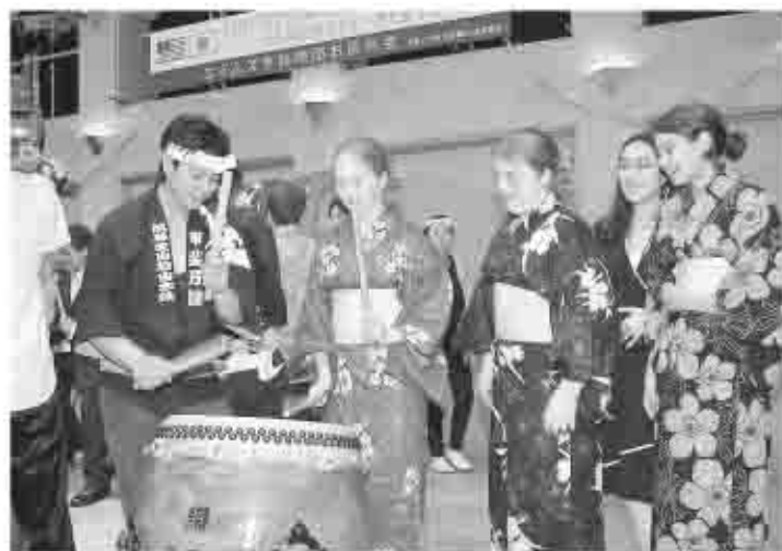
6月25日の「お別れパーティー」では、風林火山塩山太鼓の皆さんも参加していただきました。エイムズの子もたちも一緒に太鼓をたたき、甲州市最後の夜を楽しみました。