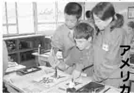
勝沼中学校で書道を体験