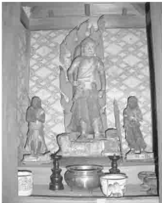
地元住民が長い間、地区の守り神として守ってきた、厨子に安置されている山本勘助不動明王像