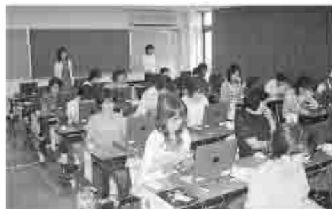
パソコン教室で生涯学習