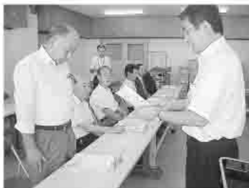
下水道事業審議会の委員に委嘱状が市長より手渡された。