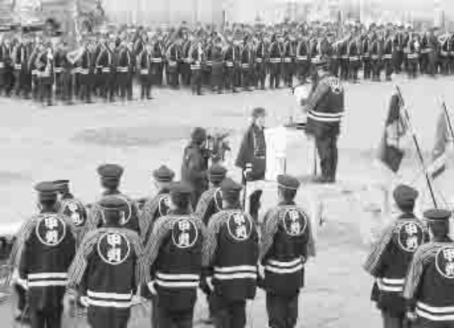
日ごろ、地域の消防・防災活動に貢献している団員の表彰や感謝状の贈呈が行われた。来賓の方々や団員など、約650人が参加