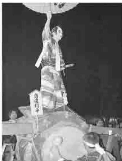
塩山藤木地区では、江戸時代から伝わる民俗芸能「藤木の太鼓乗り」(市無形民俗文化財)。太鼓の上では、歌舞伎の名場面を演じた。

市内各地で1月14日を中心に、小正月行事が行われました。地域ごとき特色ある神楽や太鼓乗り、どんど焼きなど伝統行事が受け継がれ、無病息災、家内安全などを祈願しました。それぞれの地域で子どもからお年寄りまで多くの人でにぎわいを見せていました。