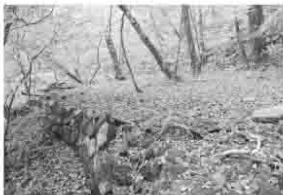
黒川千軒の中央付近のテラスで、通称「代官屋敷」といわれる。290面確認されたテラス中、最も面積が広い。前後に石垣が設けられる。

黒川金山は甲州市塩山上萩原宇萩原山の、黒川鶴冠山東斜面に位置する。現地にはかつて鉾山町であった「黒川千軒」と呼ばれる小テラス群が、谷に沿って上下六百メートル、最大幅三百メートルにわたって残されている。標高は町跡の先端が一三九〇メートル、下端が一〇八〇メートルで、標高差二一〇メートルを測る。 昭和六十一年から平成元年までの四〇年、東京大学を中心に黒川金山遺跡調査会が組織され、夏の間だけであるが発掘調査や古文書調査が実施された。その結果、先述の黒川千軒の規模