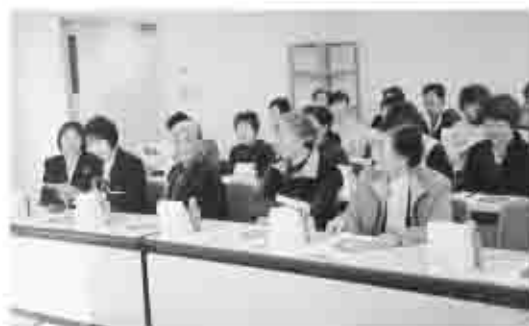
愛育会は、身近にある介護保険施設や、介護サービスの現状について学び、活動に展開

「ハートフル塩山」の利用者の方達は、入浴や食事、レクリエーションなどを通して、心や体の動きを維持できるようにスタッフのよい適切なサービスが受