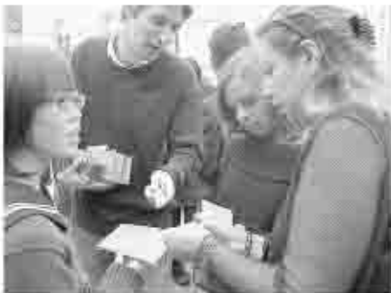
市民主体の交流とお互いの異文化を学び、尊重しあう交流を目指す国際交流

10月3日から10日まで、私を団長に34名の訪問団でフランス・ポーヌ市を訪れ、甲州市として改めてポーヌ市との友好都市の調印締結を行いました。