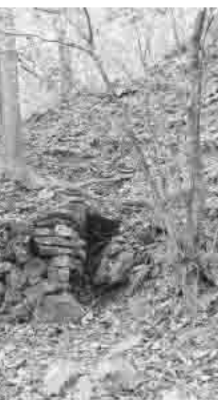
「黒川金山の坑口」 間口が狭く、奥はすでに落盤により埋もれている。

やテラスの数が二九〇面ほどあること、さらにテラスから検出された遺構や出土した遺物の内容から、テラスごとに役割の異なる建物・施設があったこと、市内に金山関係の文書を有する「金山衆」の屋敷が多く残されていること、などがわかった。これらの調査成果は、報告書『甲斐黒川金山』（平成九年三月発行）としてまとめられ、これまで謎の多かった黒川金山について学術的な評価がされるに至った。以下、金山の概要について記す。