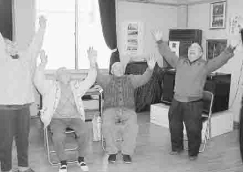
簡単な体操で体をほぐします。(老人福祉センターサロン)