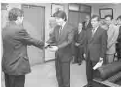
市長から指定管理者に「指定管理者指定通知書」が手渡されました。