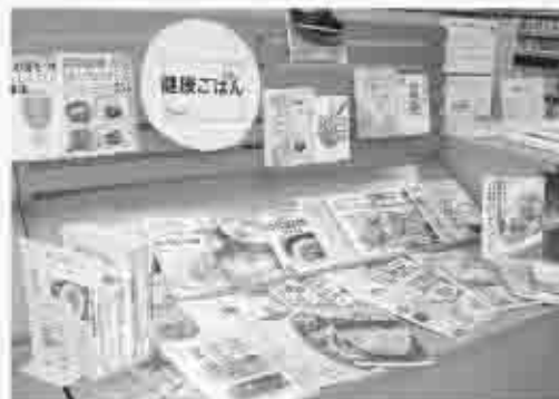
1月は「健康ごはん」を特集しました。

勝沼図書館では、カウンター前コーナーにて季節の行事や旬の特集テーマを扱った本の期間展示・貸出を行っております。毎回様々なテーマごとに本を紹介していますので、利用の際に参考にしてみたいかがでしょうか。普段とは違った視点で本に触れることで新たな発見があるかもしれません。また、併せて館内には季節の展示も行っていますので、お楽しみください。