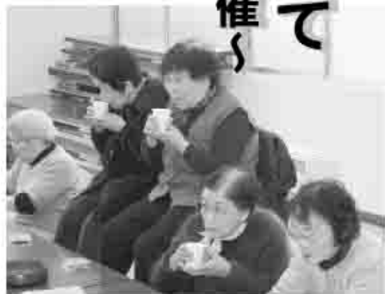
お茶の時間も楽しみのひとつ。世間話をしたり、多くの方とふれあい心も体も元気に

高齢になっても住み慣れた地域でいきいき暮らしたいと誰もが願っていると思います。そのためには自分自身が元気でいること、また隣近所でのちよつとした見守りや助け合いと社会参加の場があることが大切になります。