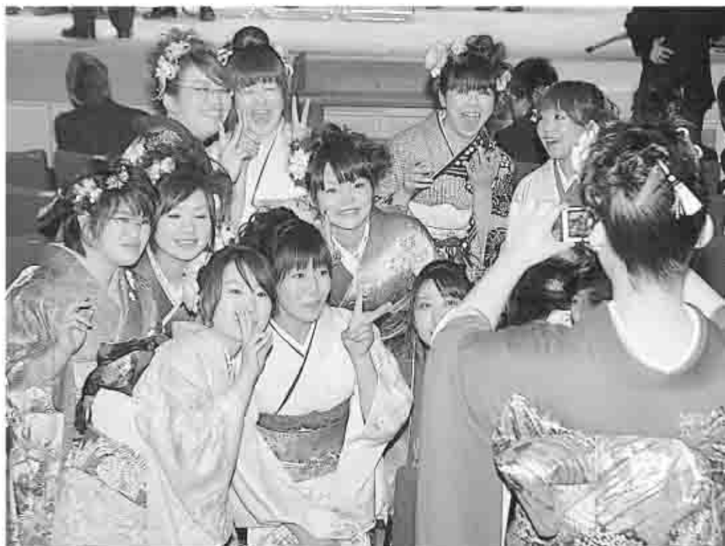
人生にとって節目の日、社会人としての第一歩を刻む。甲州市の明日を担う力として活躍してほしい。

1月6日、甲州市民文化会館で成人式が行われました。大人への第一歩を踏み出した、市内428名の新成人のみなさん。久しぶりに会う同級生や恩師との再会に、近況や思い出話に花を咲かせていました。式典やレセプションは、すべて新成人による実行委員会の手で企画、運営。手づくりによる熱意が伝わってくるような式典が、厳粛の中にも和やかに進められました。 今号では、式典の様子をカメラで追いながら、新成人の声を聞いてみました。