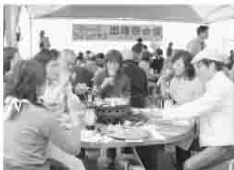
ぶどうの丘から景色を眺め、ワインとパーベキユーを楽しんだ参加者

四番隊を結成。およつちよいプラザ七里で出陣式を執り行い、鎧兜に身を包み、勇敏に侵攻しました。