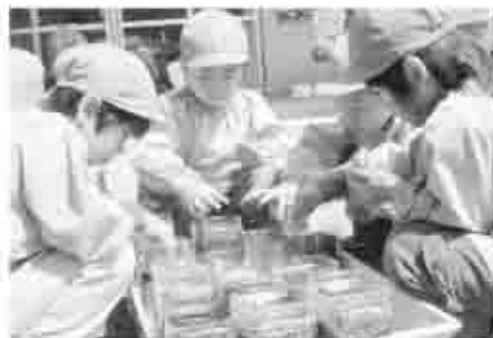
大和保育所での種まきの様子

市内のすべての保育所(園)・幼稚園では、子どもたちが野菜づくり体験をしています。 四月十日、大和保育所では、二十日大根の種まきをしました。 育つのを楽しみに、約一カ月後には収穫です。年長さんが中心になって、地域の食生活改善推進員さんと、取れた二十日大根を使って、サラダづくりをする予定です。その様子は、五月のCATVで放映します。