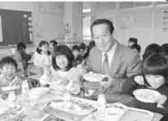
児童と一緒に給食を食べる古屋校長