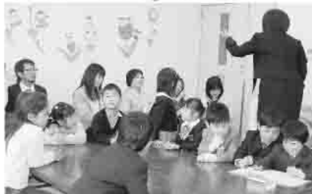
児童クラブが子どもたちに学びの場として提供したい。