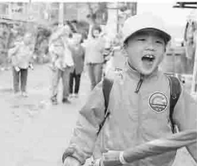
家庭における生活の安定と児童の健全育成に役立てる児童手当制度

なお、3歳到達後の翌月からは、第1子および第2子の手当額は5千円となります。3歳以上の児童の児童手当の額、支給対象年齢および所得制限限度額については、現行どおりです。