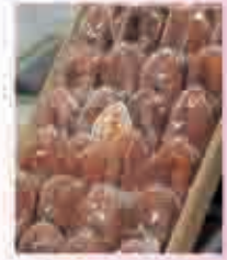
広告サンプル(原寸大)