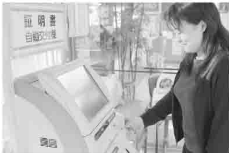
本庁舎入り口に自動交付機を設置