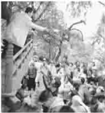
伝統行事が守り受け継がれ、地域づくりにつながる。

このお祭りの目玉として、地元祝地区の厄年（42歳）の男性が神楽殿からお餅やお菓子などをまき、訪れた方はお祭りを楽しみました。親から子へ地域の伝統行事が守り受け継がれています。