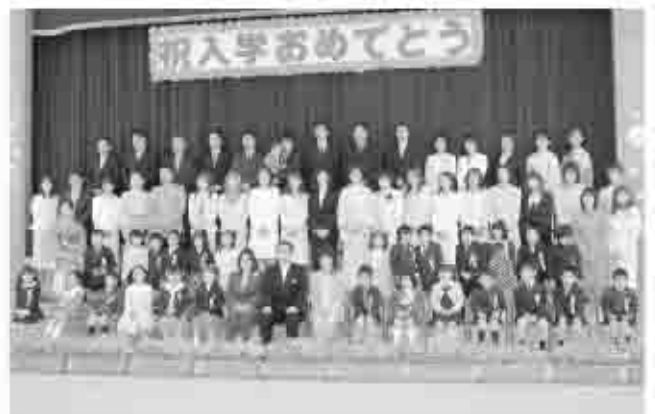
楽しい学校生活が始まった新一年生。（写真は勝沼小）

お父さんやお母さんに手を引かれ期待と不安が入り混じった面持ちで入学式に参加しました。