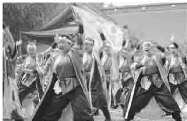
「甲斐◇風林火山」のみなさんがお祭りを盛り上げた

境内では、露店や上野原市の舞踊グループ「甲斐◇風林火山」のメンバーが威勢良く踊りを披露。お祭りを一層盛り上げました。