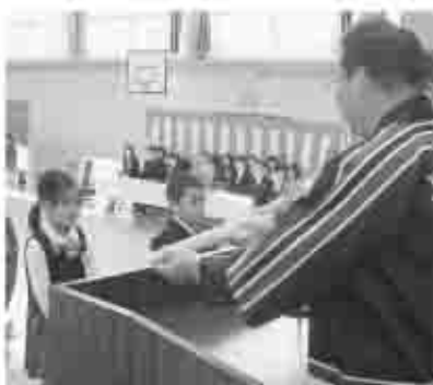
日下部署と塩山安全協会から新入生に黄色の交通安全傘が贈られた。（写真は奥野田小）