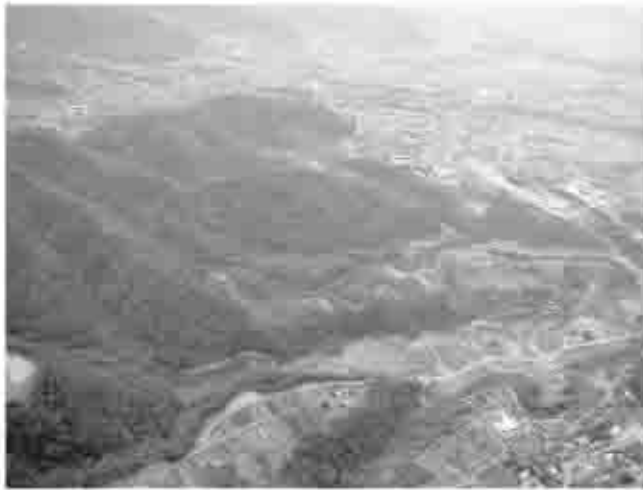
対象事業実施区域周辺（笛吹市境川町寺尾地内）

方法書とは、環境影響評価を行う項目やその項目についての調査、予測および評価の方法を記載したものです。