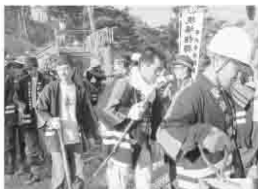
重さ約10～15kgにもなるジェットシューターを背負い、急傾斜の山中で消火活動をする消防団員