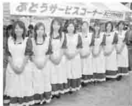
かわいい衣装を着て、甲州市のPRをしてみませんか!