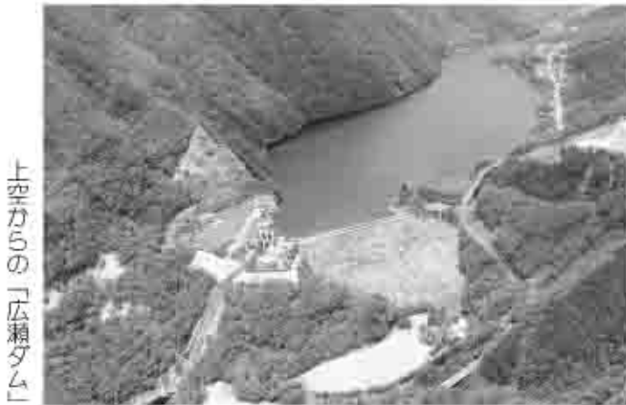
上空からの「広瀬ダム」