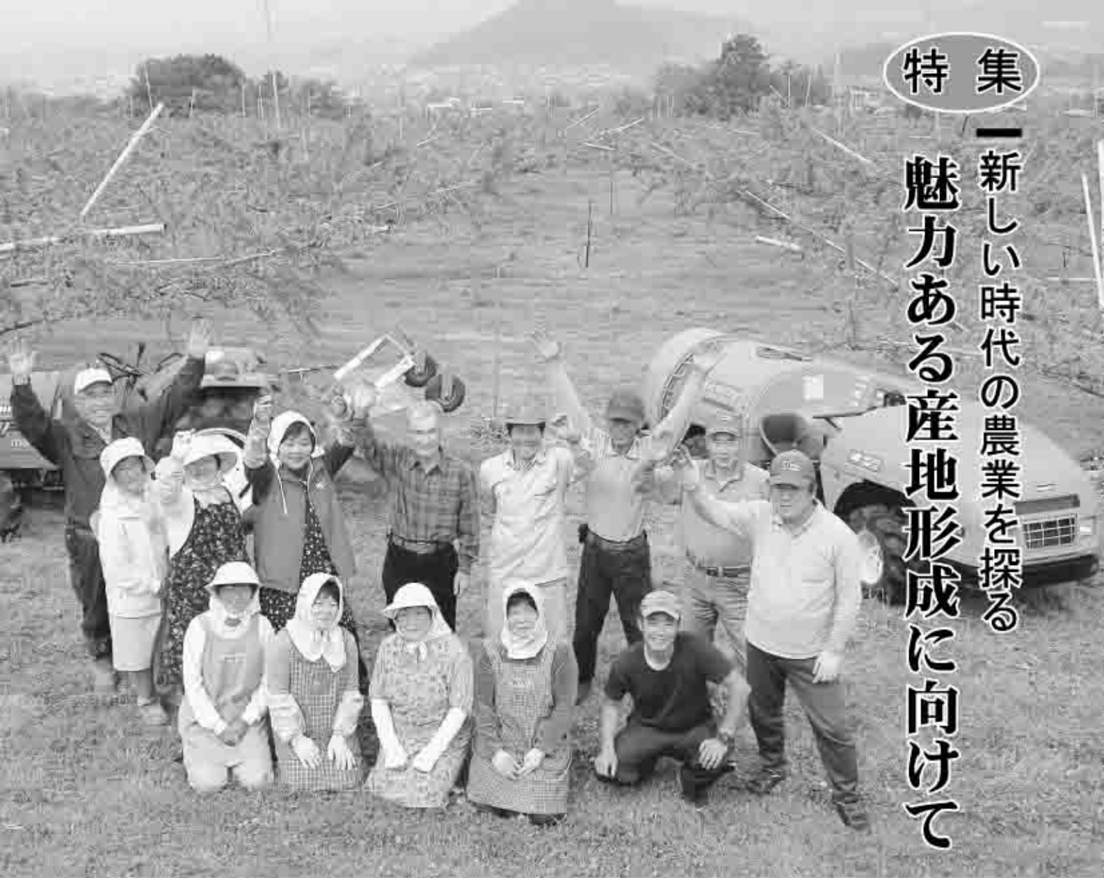
平成18年、全国農山漁村いきいきシニア活動において最優秀賞である農林水産大臣賞を受賞した「らくらく農業推進委員会」のみなさん