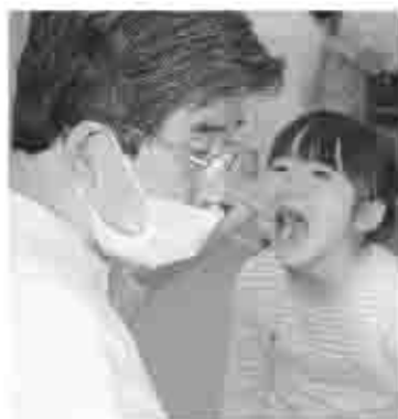
自分で行う「セルフケア」だけでなく、歯科医院でチェックしてもらう「プロケア」も大切です。

歯は言葉の発音にも関係します。人と話す時、自分の思うとおりには、はっきりと話せるために歯の存在と口の動きがとても重要です。