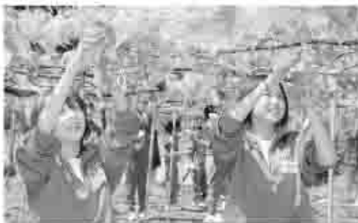
自分たちの住む地域の産業を学ぶジベ処理体験(今年は11件の農家で実施)

実習を行ったのは、2年生89名。作業に汗を流しながら手を真っ赤に染め、一房ひとふさでいねいに作業をしていました。