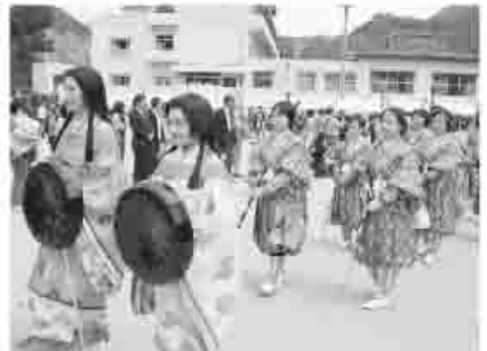
NHKの大河ドラマ「風林火山」の影響もあり、観光客でにぎわっていた