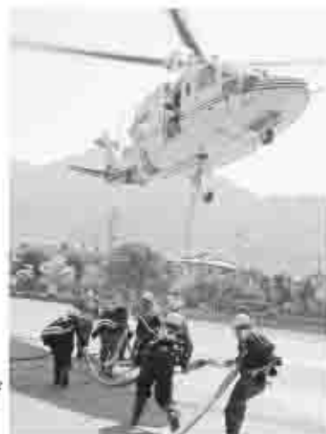
3日間、延べ113回、上空からの散水が防災ヘリや自衛隊ヘリから行われた。