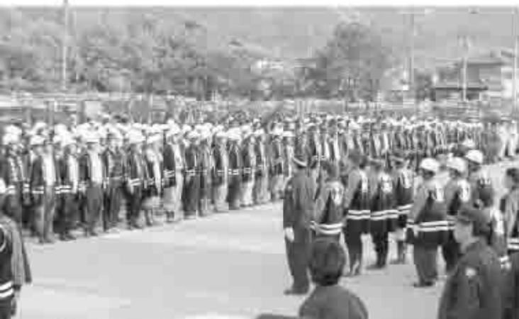
3日間、延べ約1,000人の消防団員および関係者が消火活動に参加。