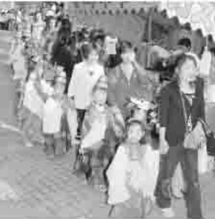
お祭りに花を添えたかわいくお稚児行列

この日の試合では、市内の小中学校の児童・生徒がボールボーイやエスコートキッズとなり参加。また、試合前には、田辺市長、ぶどう娘から両チームにハウスのぶどうと桃が手渡されました。