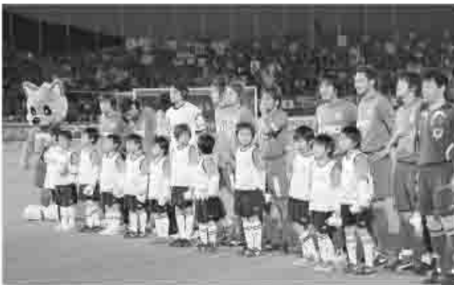
選手といっしょに手をつなぎ入場。子どもたちは、グラウンドの広さや芝の感触に感激していました。