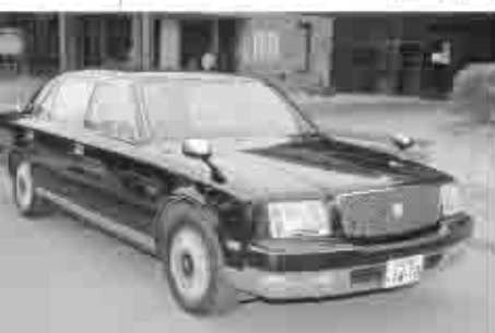
トヨタ：センチュリー (5.0デュアルEMVパッケージ装着車) (年式) 2001年 (走行距離) 4.8万km (車検) 検20年12月 (色・修復歴) 黒・なし