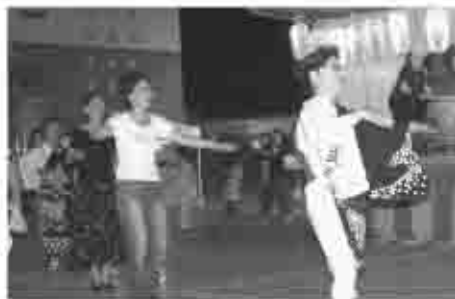
多くの参加者は夏の暑さを忘れ、楽しんでた。

当日は、ボランティアのみなさんによる盛りだくさんの出店がされ、また、盆踊りや勝頼公太鼓の演奏、フィナーレには華やかな打ち上げ花火が大和の夜空に舞い上がり、多くの来場者にぎわいました。