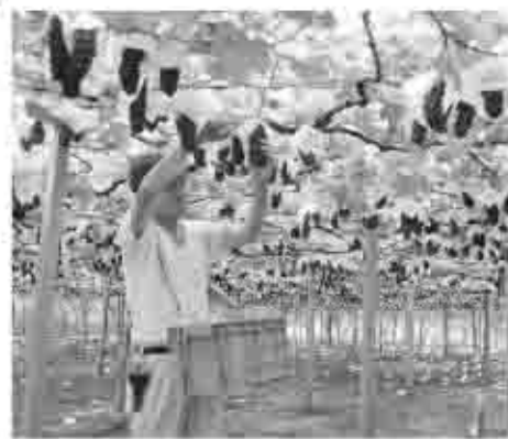
収穫の秋を迎えるぶどう園。市内はぶどうとワインで活気に満ちた季節

市では、本年度から専門のワイン振興担当を設置し、日本を代表するワイン産地である甲州市を全国に発信していきます。