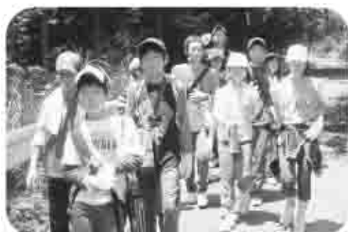
山の中を追跡ハイキング。大自然を肌で感じた。大学生などがカウンセラーとなり子どもたちを指導。