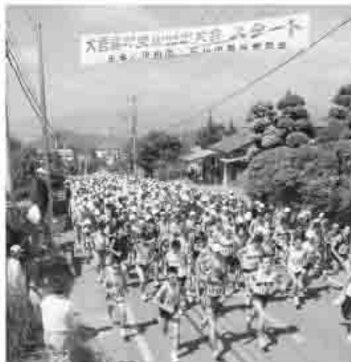
一般と壮年Aは15.7キロ、壮年Bと女子、中学生は上日川峠までの12.6キロのコース