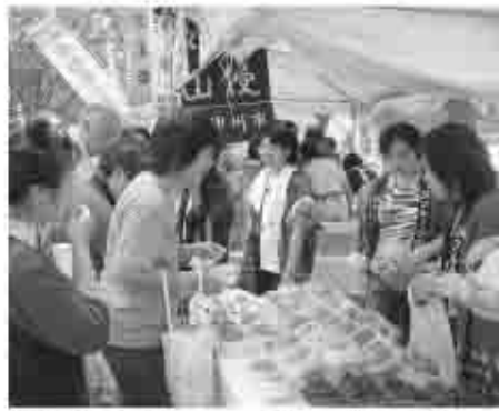
甲州市のぶどう、ワイン、桃などをPRし、会場は賑わった。

甲州市塩山農業振興協議会では、消費拡大・宣伝活動の一環として参加しました。会場となった東京都世田谷区馬車公苑前並木通りでは、桃など特産品の販売をし、甲州市のくだものや観光をPR。会場は試食の桃などが振舞われ、賑わいを見せていました。