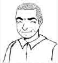
今回紹介していただいた 生涯学習課長(似顔絵)