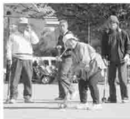
日々の生活の中で前向きに楽しい日々を送り「生涯現役」をめざしましょう。

「午後2時に行かなくてはと思うと、午前中には家事や用事を済ませるように朝も早く起きるし、1日のリズムができてとてもいいです」「鍵のことが無ければ今日はいいやなんて思うかも知れないけど、頑張っ行ってます」と話してくださいました。鍵の管理という役割が負担ではなく、励みになっているのだと思いました。