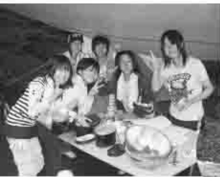
各班、それぞれ別のメニューを料理。みんなで協力しておいしい食事ができたようです。