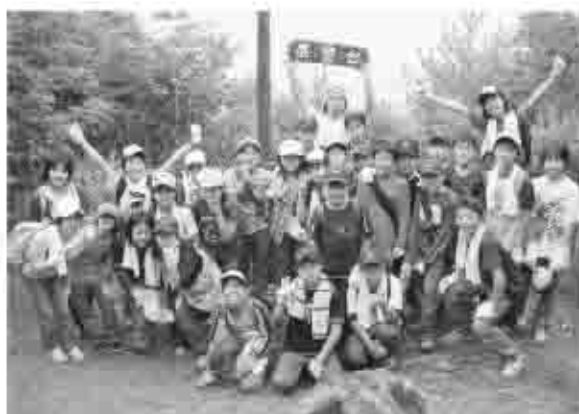
大滝キャンプ場から大滝不動尊を經由して徒歩2時間。展望台に到着。景色の美しさに驚いた子どもたち。

勝沼町では、勝沼の4つの小学校の6年生を対象にした勝沼少年ジャンボリーが7月21日から23日までの3日間、大滝キャンプ場で行われました。