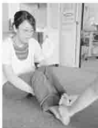
足つぼマッサージで、心も体もリフレッシュしてみませんか？