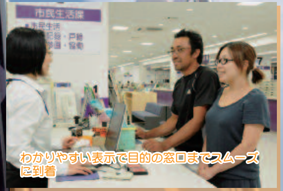
わかりやすい表示で目的の窓口までスムーズに到着