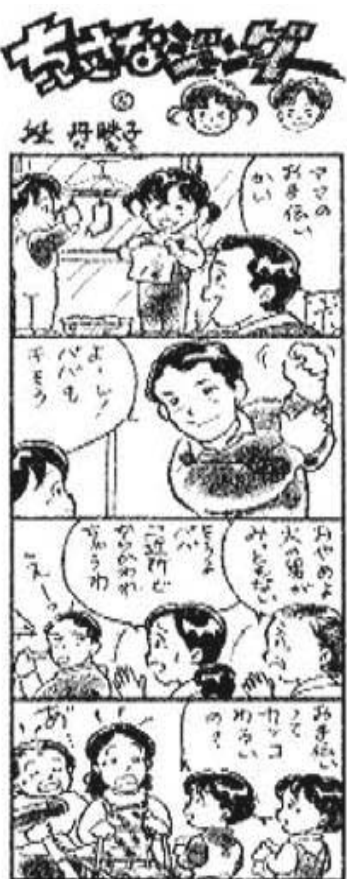
C段丹映子・「週間長野」掲載・無断転載禁止