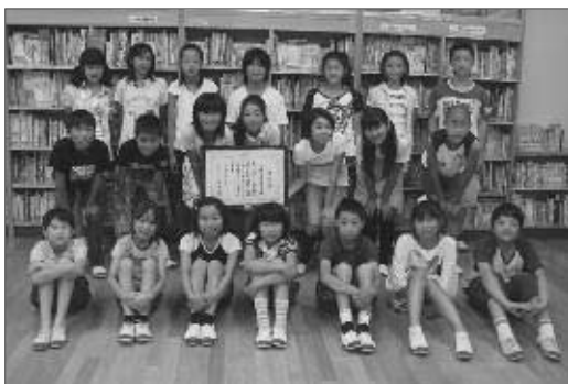
勝沼小学校6年生の皆さん