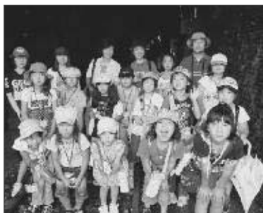
本を通じて、たくさんの方のことを学ぶ「カムカムクラブ」

国民読書年のイベントとして4つの図書館では、皆さんがお勧めする本を、より多くの皆さんに紹介するイベントを開催しています。 「涙が止まりませんでした」「勉強になりました」など、一冊の本に秘められた感動を一枚の手紙で伝えることで、心の交流が生まれます。 現在、各図書館にて募集をしています。本を紹介することで、図書館の新しい楽しみ方が発見ができますね！