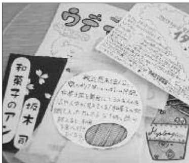
自分だけのオリジナルレター！

市内4つの図書館では、子どもからお年寄りまで皆さんが楽しめるイベントなどを毎月の広報でお知らせしています。今月は23ページをご覧ください。