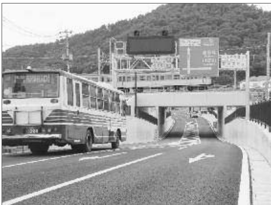
一部供用開始した「新・仲沢ガード」

交通渋滞の解消と観光地とのアクセス道路として整備していた、県道・塩の山西広門田線に架かるJR中央線のガード（通称仲沢ガード）が、6月29日に一部供用開始となりました。新・仲沢ガードは、大型車両の通行を可能にしたと同時に、学生や高齢者が安心して通行できる歩道を設置。また、甲州市内の観光地へのアクセス道路として、集客アップにもつながることが期待されます。