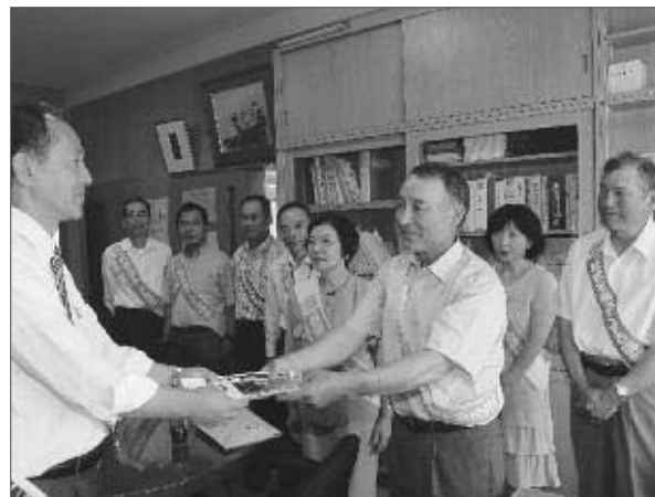
東雲小学校で広報活動する委員会の皆さん

社会を明るくする運動推進委員会は、法務省主唱の同運動強化月間の活動の一環として、7月1日に市内の小中学校や農協など、45箇所を訪問し広報活動を行いました。委員会の皆さんは、それぞれの訪問先で「犯罪や非行の防止と罪を犯した方々の更生についての理解と支援、犯罪や非行のない明るい社会を築くには、地域の連携が必要」と協力や支援の呼びかけをしました。