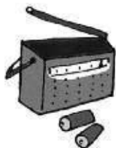
●携帯ラジオ(FM付き) 予備電池