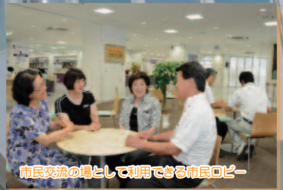
市民交流の場として利用できる市民ロビー