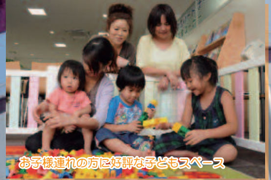
お子様連れの方に好評な子どもスペース