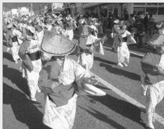
市民総参加で賑わう甲州市 およっちょい祭り