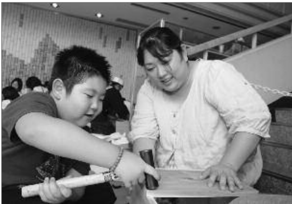
木工作业に励む参加親子

塩山建設組合と塩山ライオンズクラブは8月21日に、甲州市民文化会館で親子木工教室を開催しました。当日は70組、約100名の親子が、クギやトンカチを使って本棚づくりに挑戦しました。作業中は、慣れない手つきの子も達を見つめる保護者からは「木工作业を通じて、自然のぬくもりを子ども達に教えることができ、また、工作の楽しさや親子でやり遂げた達成感をあじわえた」と親子で最高の思い出を作っていました。