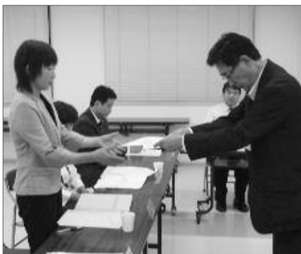
20名の市民協働に関する指針策定委員が委嘱されました