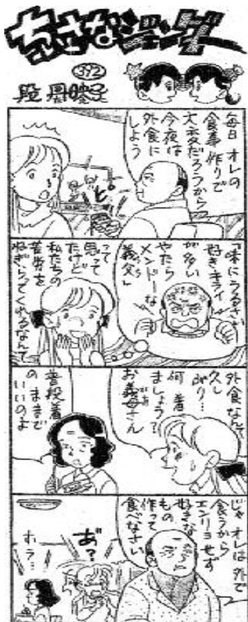
C段丹映子・「週間長野」掲載・無断転載禁止