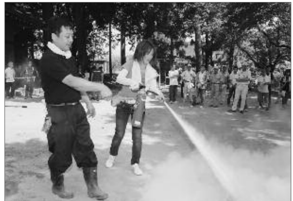
初期消火訓練を受ける参加者（上塩後地区）

9月1日は防災の日。甲州市内の各地区では、防災の日を中心に多くの皆さんが参加して防災訓練を行いました。それぞれの地区では、防災器具の確認、地元消防団員による指導のもと、初期消火訓練や応急手当、AED（自動体外式除細動器）の活用方法を学ぶなど、様々な訓練が行われました。参加者からは「地域住民の協力が大切」との声が聞かれ、日頃からの「備えあれば憂いなし」を改めて実感した1日となりました。