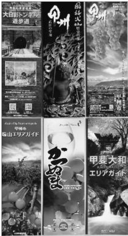
観光客から大好評の 甲州市ガイドマップ