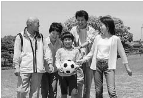
健康で充実した生活を！

生活習慣病とは、毎日のよくない生活習慣の積み重ねによって、ひき起こされる病気です。近年では、日本人の3分の2近くの方が、この生活習慣病で亡くなっています。 原因としては、日常の食生活や運動などの生活習慣による影響が強いといわれます。 この病気は、本人に自覚症状のないまま、知らないうちに血管を蝕んで動脈硬化が進行します。 しかし、普段の生活習慣を見直し改善することにより、病気を予防し、症状が軽いうちに治すことができます。 現在、甲州市では各地域を巡回して総合健診を行っています。健診では、基本健康診査と各種がん検診など、単に異常発見のみだけでなく、