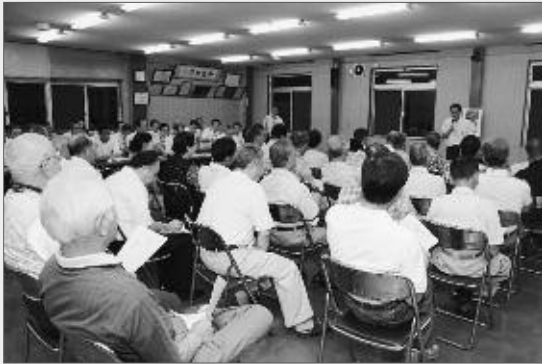
将来のまちづくりについて語り合った懇談会市民懇談会（9/8 大藤地区）

地域の声を市政に反映させることを目的に、田辺市長が地域に出向き、地域の要望や将来へのまちづくりについて語り合う「こうしゅう市民懇談会」が、6月25日の大和地域をスタートに本年度も開催しています。各地区で順次開催いたして参りますので、ぜひ、ご参加ください。