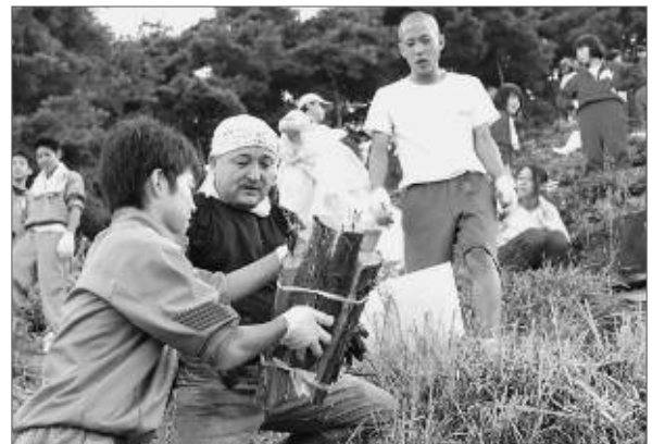
130名の地域住民による護摩木積み

10月2日開催の第57回甲州市かつぬまぶどうまつりのクライマックスを飾り、地域の伝統行事である柏尾山の鳥居焼き。今年も、鳥居焼きの準備に約130名の地域住民ボランティアが集まり、護摩木積みを行いました。急な斜面に約300個の護摩木の束を井形に積み上げ、縦80M、横60Mの鳥居型に配置。参加者は「先祖への供養とブドウ収穫の感謝の気持ちを護摩木に込める」と地域に受け継がれてきた伝統を感じて作業に汗を流していました。