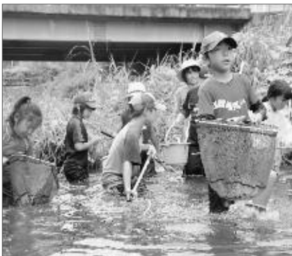
7月29日に開催した川歩き

さらに、本市特有の貴重な景観を守り、新たに創出していくために「景観計画策定審議会」を設置し、市民の皆様と協働による検討を行って参ります。