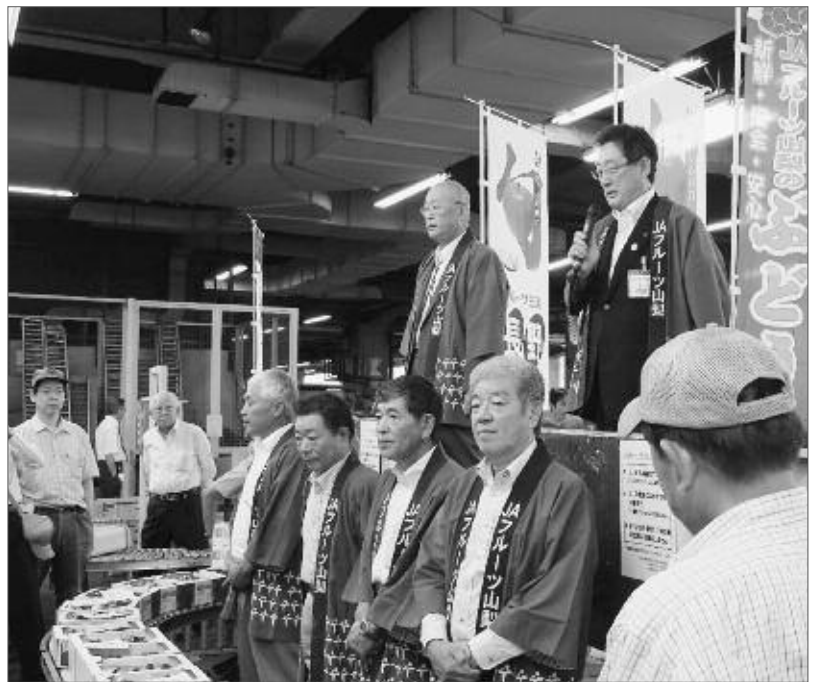
全国で一番に美味しい甲州市産ぶどうをPRする田辺市長（大阪府）

7月22日には、東京大田市場で、8月28日には、大阪市場でトップセールスを行って参りました。