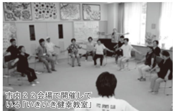
市内22会場で開催している「いきいき健幸教室」

のニーズを的確に対応した時刻表と運行ルートを設定しており、季節ごとに調査や研究を行い、ダイヤ改正などを行っております。今後も、多くの皆様の声を反映できる公共交通に努めて参ります。