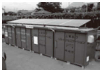
昨年認定を受けた上東地区リサイクルステーション太陽光パネル設置事業