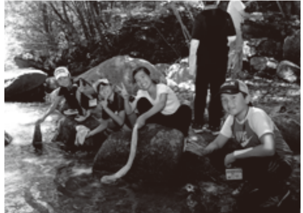
日川の清流にもふれてみました。