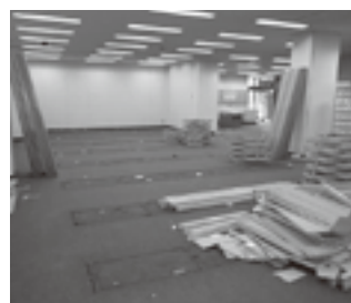
本棚撤去後の塩山図書館

平成26年3月31日まで、リニューアル工事に伴い休館となっています。中央公民館南側駐車場に仮設事務所及び返却ボックスも設置されていますのでご利用ください。現在塩山図書館の資料をお持ちの方は、至急返却をお願いします。