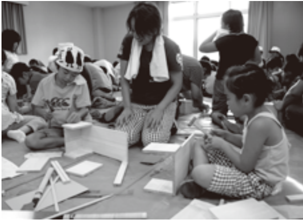
兄妹で貯金箱作りに挑戦

親子での共同作業は大いに盛り上がり、建設組合の皆さんによる指導もあり、すべての親子が貯金箱を完成しました。楽しい夏の思い出を親子で作っていました。