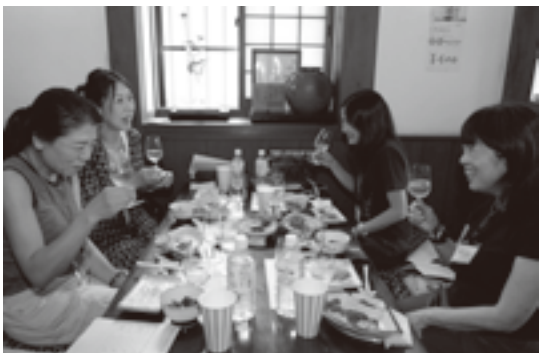
日本を代表する甲州種ワインと和の相性の良さに甲州市の楽しさを再発見していました。