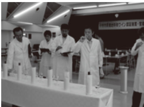
ワインの出来を審査する審査員

今回は、12社から23点のワインが出品され、結果22点が官能審査を合格しました。合格したワインは、後日ラベル審査を行い、9月5日に認証書とラベルが交付されます。