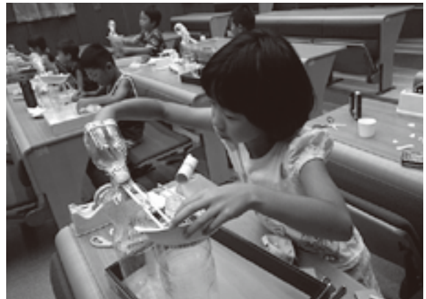
世界にひとつだけのピタゴラ装置を製作

ビー玉がうまく転がるための調整が難しく、「転がしては調整する」を何回も繰り返していました。作品を完成させた、子ども達の顔は、達成感に満ち溢れていました。