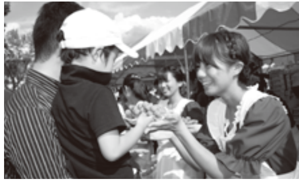
特産の甲州ぶどうの 無料サービス

焼きです。柏尾山の中腹では、幅約50メートル、高さ約70メートルの巨大な鳥居焼きが夜空に輝き浮かび上がります。鳥居焼きの原点は江戸時代柏尾山大善寺の盆送り火として7月15日の晩に行われていました。その後、明治になると仏教の排斥運動の流れや明治の大水害などにより取り止めとなってしまいました。その後、昭和9年に葡萄祭として復活し、昭和29年の勝沼町誕生以降は町制記念事業として勝沼町あげての祭りとして継続し、鳥居焼きの火と共に、ぶどうの実りに感謝する祭りとして今日まで続けら