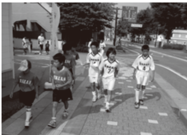
清掃活動する塩山サッカースポーツ少年団

小学校の校庭など公共施設で練習を行っている少年団は、「感謝の気持ちを込めて」と、この日は団員や保護者ら約80人が活動に参加。「きれいになると、うれしい」と3つのグループに分かれて、道路に落ちていた空き缶やごみを拾いを行いました。