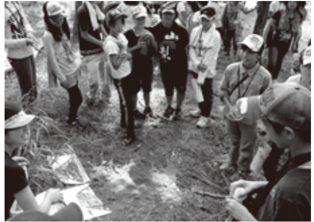
自然のもので富士山を絵描きました。