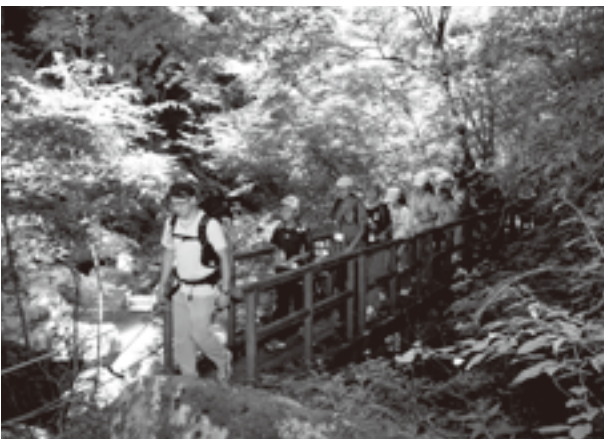
竜門峡を散策しました。