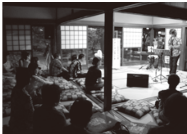
演奏に聞き入っている皆さん

演奏したA列車でいこう、上を向いて歩こう、レット・イト・ビー、星に願いをなど、誰もが聞き覚えのある曲に会場は、酔いしれていました。