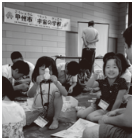
フィルムケースでロケットを作ったよ！

参加した親子は、「葉脈標本で葉脈に色を塗るところが難しかったです。フィルムケースロケットは、先端のスポンジを削るところが難しかったが、よく飛んで楽しかった。」と笑顔で答えてくれました。