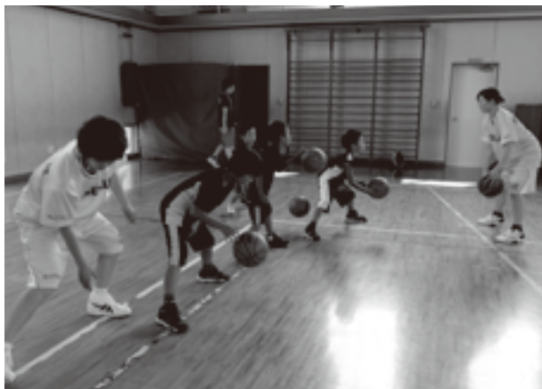
プロ選手に、ドリブルの指導を受ける団員

教室には、市内バスケットボール関係のスポーツ少年団の団員約60人が参加、ドリブルやシュートなどプロ選手からの指導に感動、最後はミニゲームで対戦するなど、記憶に残るひと時を楽しんでいました。