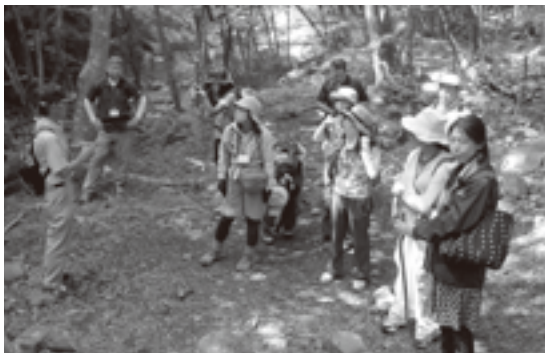
緑のトンネル、清流の竜門峡を散策する参加者。

観光客のおもてなし態勢の充実に向け、首都圏在住者や観光市場を牽引する女性をターゲットに、甲州市の観光に対する意見や課題、提案を振興策に活かすことを目的に、季節ごとに実施しています。4月に開催したツアーでは「官民一体となり分野別で研究することで新しい観光策が見つかる」など、多様な提案がありました。