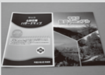
災害に備えるポイントが掲載されている、防災マニュアル(右)、土砂災害ハザードマップ(左)

飲料水、食料品、貴重品、救急用品、ヘルメット、防災ずきん、マスク、軍手、懐中電灯、携帯ラジオ、多機能ナイフ、衣類、など