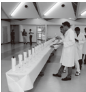
審査を待つワイン