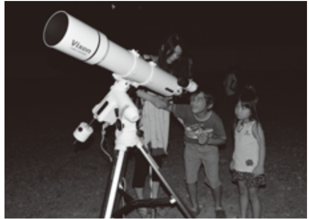
大きな天体望遠鏡を覗く親子