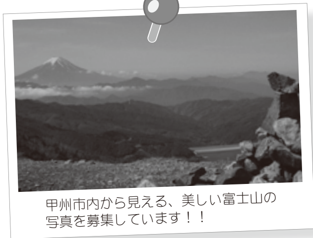
甲州市内から見える、美しい富士山の写真を募集しています!!

甲州市およっちよい祭り実行委員会事務局(甲州市商工会) 甲州市塩山上於曾1154 写真には氏名及び撮影場所を公表しますが、実行委員会では取得した個人情報について、法律に従い適正に管理します。(匿名希望の場合は、その旨を備考欄に記載してください。また、ニックネームでも可能です。)