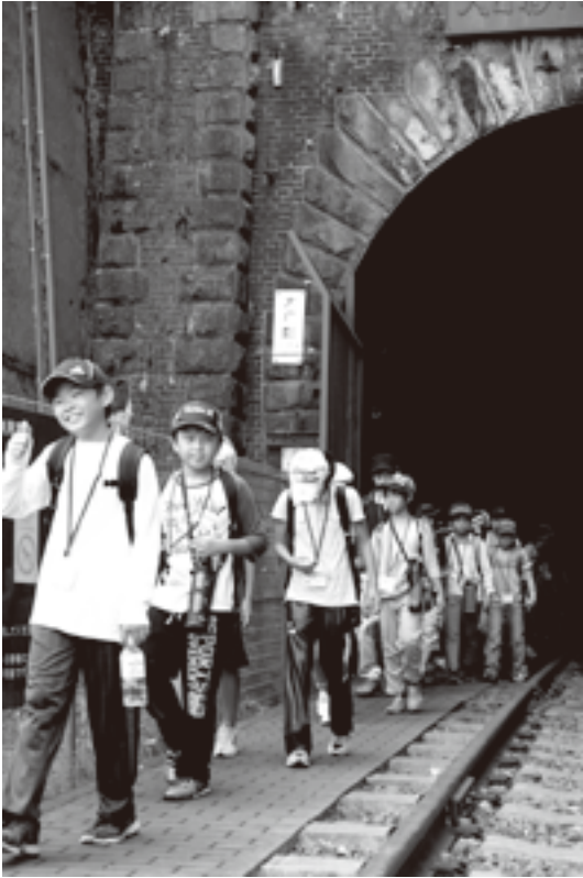
トンネル遊歩道は涼しかった～

市教育委員会は、8月8日・9日の日程で、市内の小学6年生71人が参加し少年少女ふるさと探険隊を、甲斐の国大和自然学校などで行いました。