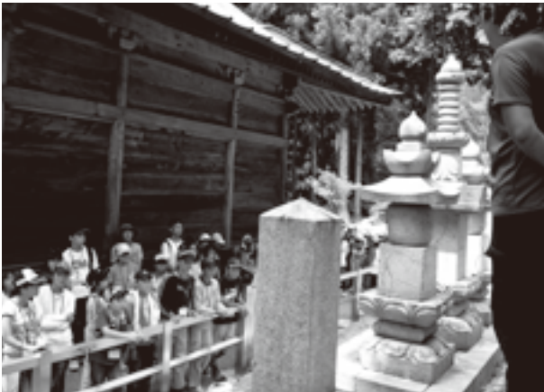
景德院では、武田勝頼公の墓を見学