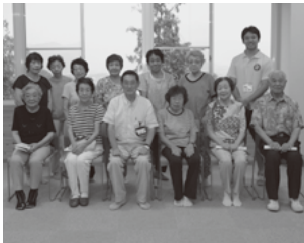
甲州市の将来を語り合う市政出前懇談会 写真：いきいき健康教室（8月23日）

今後も、多くの皆様と語り合い、寄せられたご意見、ご要望を市政運営の貴重な財産として、様々な分野に反映し、「住んで良かった、これからも住み続けたい甲州市」を市民の皆様と共に描いていきます。