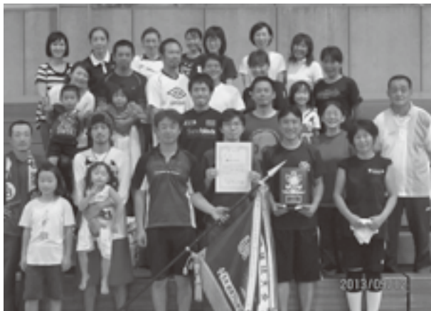
50回の記念大会優勝 勝沼3区Aチーム

会場では、大きな声で選手を応援する多くの地元サポーターも訪れ、白熱した試合は大いに盛り上がり、存分に楽しんでいました。