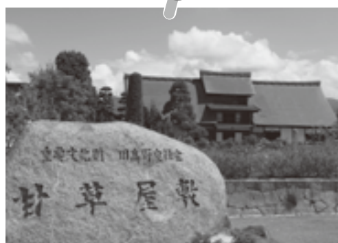
旧高野家住宅「甘草屋敷」

栽培地としては本市が特に有名で、JR塩山駅北口の旧高野家住宅・甘草屋敷には、幕府に甘草を納めていたことを示す古い文書が現存し