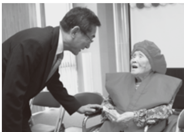
「おめでとございます」と長寿のお祝いをする田辺市長

甲州市と甲州市社会福祉協議会は9月15日、本年度に百歳を迎える22名の長寿の方へ慶祝訪問を行い、お祝状および記念品の贈呈を行いました。