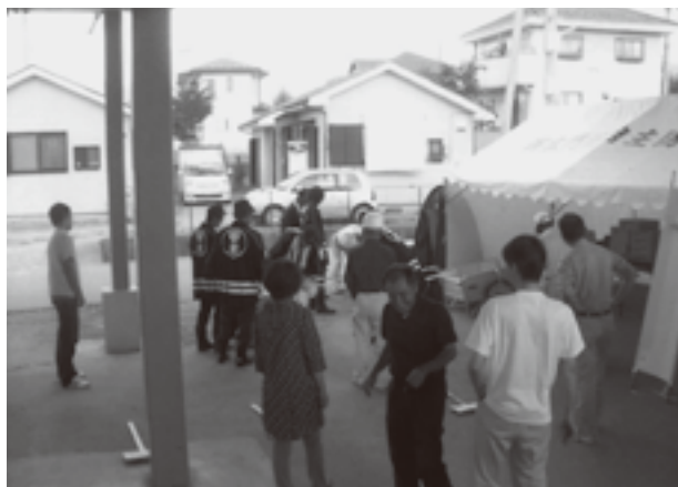
新しい発電機を試運転する住民の方

このコミュニティ事業は、宝くじの社会貢献広報事業として整備を行うもので、地域社会の健全な発展を図るとともに宝くじの普及広報を行うものです。