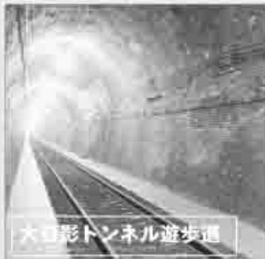
大日影トンネル遊歩道

信玄の里コース ■受付時間 午前9時〜午前10時30分 ■集合場所 旧高野家住宅「甘草屋敷」 ■コース 甘草屋敷↓向嶽寺↓秩父往還↓常泉寺↓恵林寺(信玄公宝物館)↓放光寺↓塩山ふれあいの森総合公園↓甘草屋敷