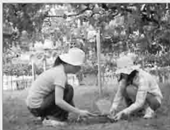
土を採取し地域の特徴を探る

また、土壌を通して「勝沼がなぜ世界有数のぶどう産地と成り得たのか」という素朴な疑問にせまります。多くの皆さんにご協力いただいた今回の企画展を、実際に目で感じて下さい。