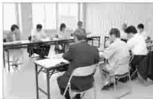
行政改革推進委員会

また、本市を取り巻く社会・経済情勢は、めまぐるしく変化を続けており合併前の予測に加え、数々の新たな行政課題に対応するため、昨年3月には、10年間のまちづくりの基本理念や具体的方針を定めた「第一次甲州市総合計画」を策定、市の将来像を「豊かな自然 歴史と文化に彩られた 果樹園交流のまち 甲州市」とし、少子・高齢化社会への対応や、観光・産業の振興、教育・文化の振興など、優先度、緊急性を考慮しつつ、総合計画の推進に取り