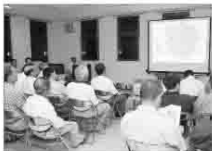
市内13箇所で開催された市民懇談会（写真：玉宮地区）

このため、宝くじ助成事業を活用して来年3月に、塩山駅南側地域の課題や市庁舎移転による街の機能を考える機会として、この地域を市民の皆様と歩き、まちを見て、まちを語り、まちづくりの糧とする第2弾のシンポジウムを開催する等、まちづくりへの感心を高めていく計画です。