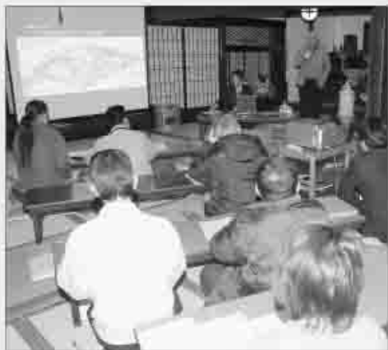
100名以上の方が受講した 昨年のまちのソムリエ養成講座

※当日の資料や講演録を「あるくこうしゅう」ホームページにも掲載しますので、ホームページによる受講も可能です。市外の方の受講も大歓迎です。