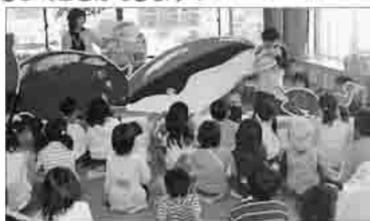
昨年のカムカムフェスタの様子