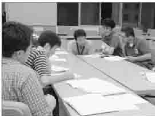
スタッフによる打ち 合わせにも熱が入る