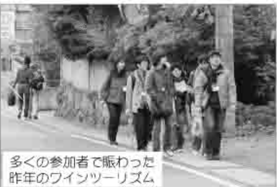
多くの参加者で賑わった 昨年のワインツーリズム