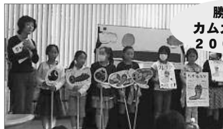
勝沼図書館 カムカムフェスタ 2009が開催♪

およっちょいまつりでのブックフリーマーケットに際し、たくさんの献本及びご協力をありがとうございました。今年度の収益金につきましては、図書購入費としてみいづ保育園に寄付させていただきました。今後も、ご家庭で不要になった図書の献本を受け付けています。詳しくは塩山図書館まで。 ～図書館友の会～