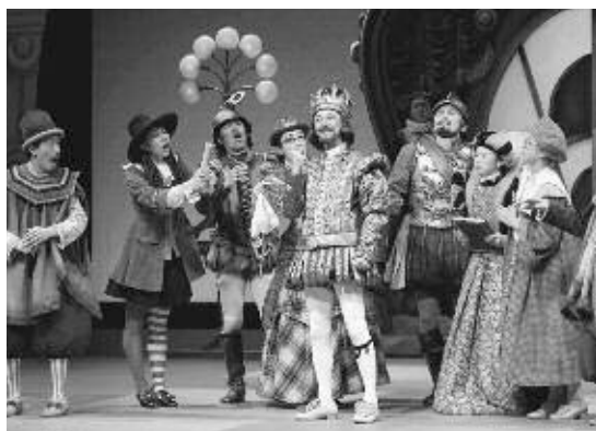
劇団四季ミュージカル「はだかの王様」