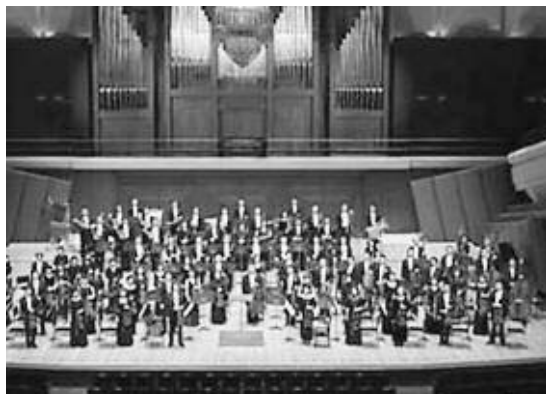
新日本フィルハーモニー交響楽団