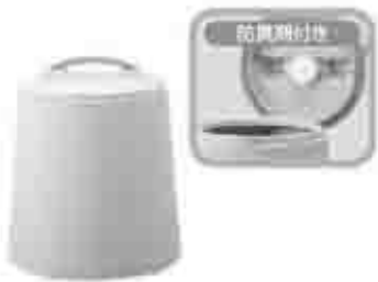
生ごみ処理容器 (コンポスト)