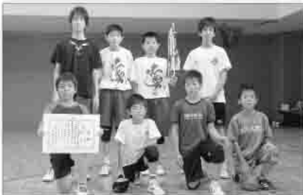
祝チーム(男子の部)

また、地域の方による大和伝統「天目山太鼓」の披露で祭りは盛り上がり、ライマックスには、みんなで盆踊りをして楽しい一夜を過ごしました。