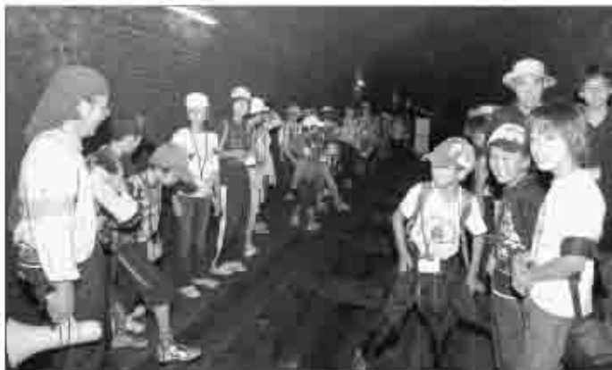
「なげ～よ、このトンネル！」延長1400メートルの大日影トンネルを歩き、100年の歴史を探検。