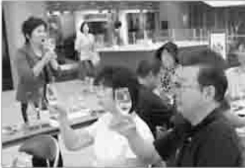
7月25日のオープン日には多くの方が訪れ「ふるさと甲州市」を楽しんでいました。

新たな地域間交流として、3月からスタートした里・まち連携事業。現在までイベントなどを通じて、自治体の枠を超えた住民同士の交流を深めています。