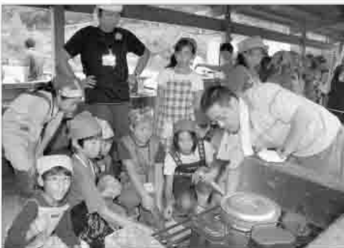
今夜の晩ご飯はカレーだよ。誰が手伝ってもらっているのは？

地域の方が伝授！ 甲州伝統子ども教室 甲州市観光ボランティアアゲイドの会は7月29日から31日の3日間、甘草屋敷と塩山南小で甲州伝統子ども教室を行いました。 期間中には、小学校の児童およそ250名が参加し、昔の子ども達が遊んだ囲碁や書道などを地域の方が講師になり伝えました。 「初めて体験したけど楽しかった」と参加した子ども達は、大はしゃぎで楽しんでいました。