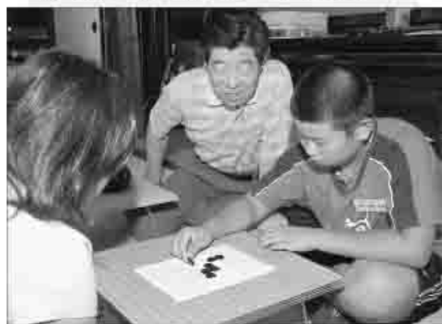
「囲碁って楽しいね」と真剣勝負が始まった。

地域の方が伝授！ 甲州伝統子ども教室 甲州市観光ボランティアアゲイドの会は7月29日から31日の3日間、甘草屋敷と塩山南小で甲州伝統子ども教室を行いました。 期間中には、小学校の児童およそ250名が参加し、昔の子ども達が遊んだ囲碁や書道などを地域の方が講師になり伝えました。 「初めて体験したけど楽しかった」と参加した子ども達は、大はしゃぎで楽しんでいました。