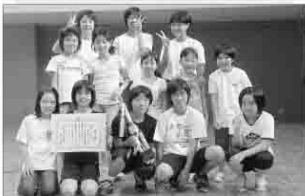
下於曾西チーム(女子の部)