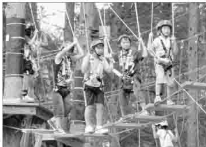
こわいけど、みんなで挑戦すれば大丈夫。

甲州市の豊かな自然と歴史文化に触れ、地域を学ぶことを目的に8月6日、7日の2日間、甲州市少年少女ふるさと探検隊を行いました。 小学5年と6年の67名が参加し、明治36年の中央線開通に合わせ建てられた大日影トンネルやトンネルワインカーヴ、また上日川峠の大自然を探検。普段は別々の小学校に通っていますが、新しい仲間と過ごした2日間は、強い絆と交流が深まっていました。