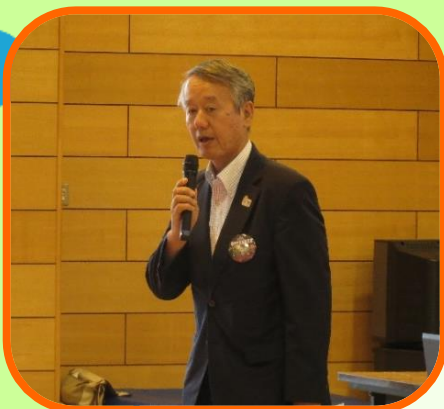
かいこうしき 開校式