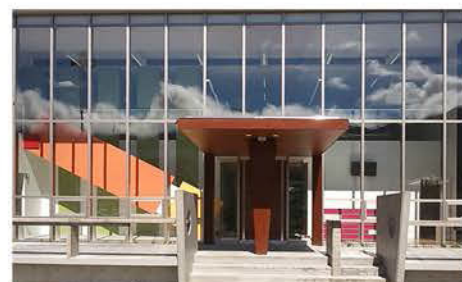
■ ホールに散りばめた7つの色