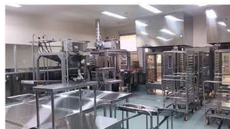
■ 焼物・揚げ物・蒸し物調理室