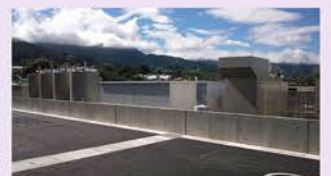
【非常用自家発電機】