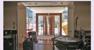
調理場から外が感じられる