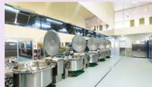
調理場から見学通路 その向こうに東の山並み