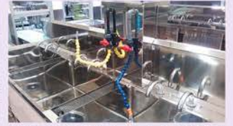
【電解水（酸性水・アルカリ水）】