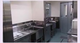
【アレルギー対応調理室】