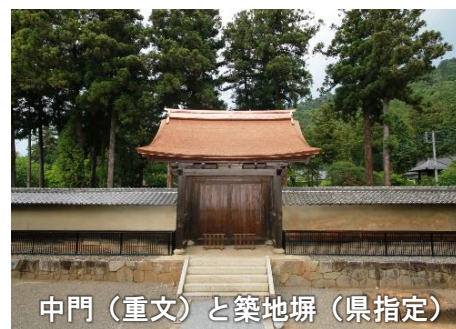
中門（重文）と築地塀（県指定）