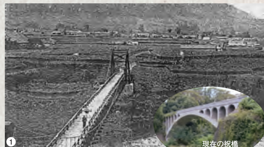
1: 祝橋と祝村(岩崎)の集落・ブドウ畑 写真は2代目の吊り橋。大正2年(1913)の勝沼駅開業の翌年、祝村から日川対岸にある駅へとブドウを出荷するために架橋された。3代目の祝橋は昭和5年(1930)に架けられたものである。