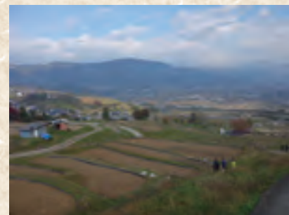
姨捨の棚田(長野県) 中世末より形成された棚田には、水路が張り巡らされ、良質な米が生産されている。