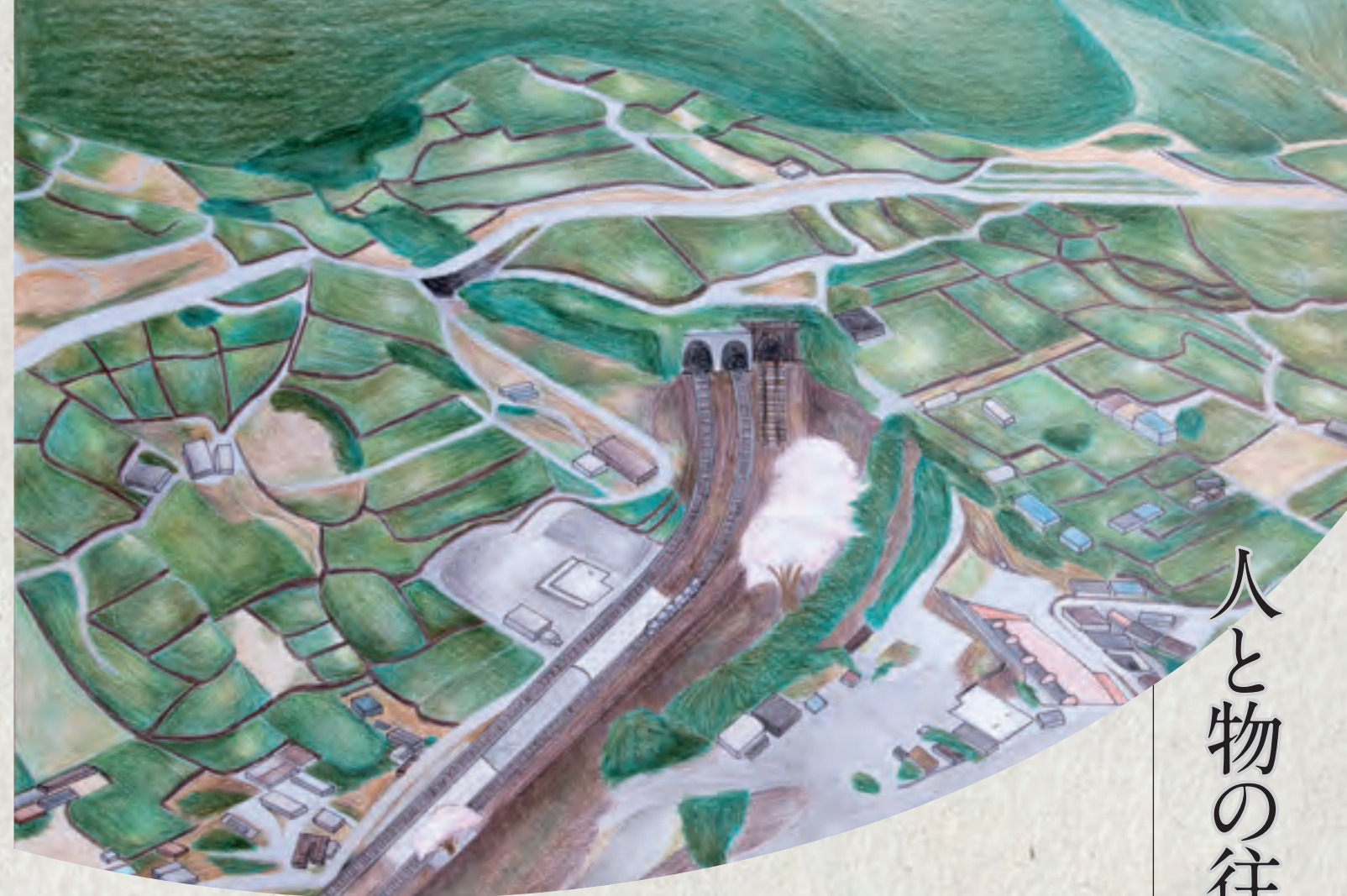
勝沼ぶどう郷駅と 煉瓦造の大日影トンネル 明治36年(1903)の中央本線開通により、ブドウ・ワインの出荷量は飛躍的に増加した。

江戸時代の旧街道、明治時代のトンネル、戦後のバイパスや高速道路といった交通インフラの整備は、甲府盆地東側の玄関口である勝沼に多くの人や物資をもたらし、勝沼からもブドウやワインが出ていきました。