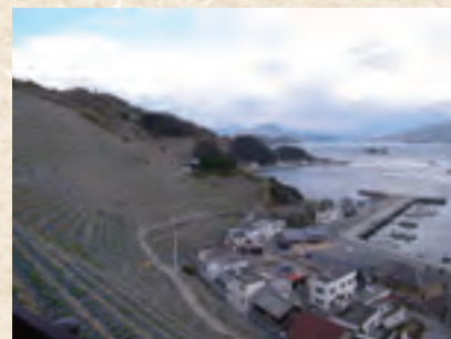
遊子水荷浦の段畑(愛媛県) 海辺の急峻な段々畑にじゃがいも畑が広がり、半農半漁の営みが続く。

地域固有の自然や文化のなかで育まれてきたこうした景観、さらにそれを形成してきた地域のシステムに価値を見だし、地域で守り、受け継ぐための仕組みが、国の文化財のひとつとしても位置づけられている「文化的景観」なのです。