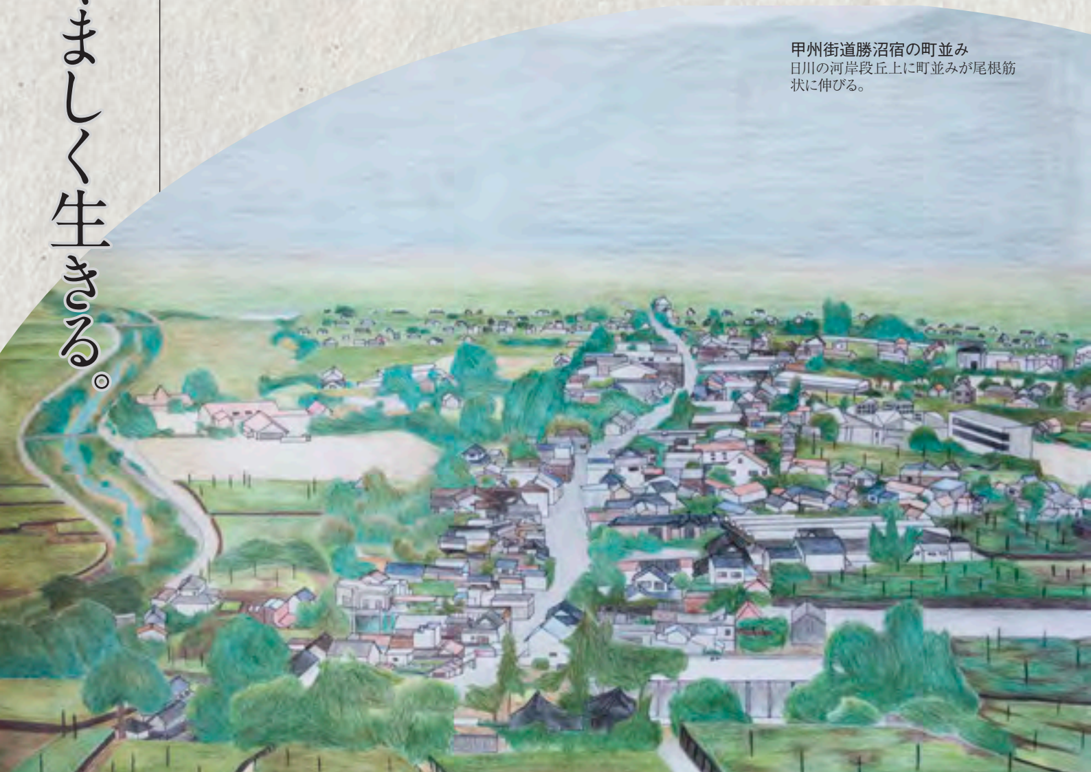
甲州街道勝沼宿の町並み 日川の河岸段丘上に町並みが尾根筋状に伸びる。

勝沼の人たちは、地形や気象がもたらす環境を受け入れ、巧みに使いこなしながら生活し、また、ブドウ栽培などの生業を営み続けています。