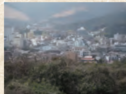
別府の湯けむり・温泉地景観(大分県) 世界一の湧出量ともいわれる温泉資源が、地域にさまざまな生業を生み出している。