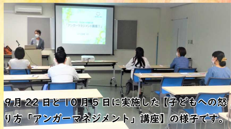
9月22日と10月5日に実施した【子どもへの怒り方「アンガーマネジメント」講座】の様子です。