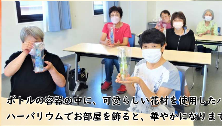
ボトルの容器の中に、可愛らしい花材を使用したハーバリウムを作りました。 ハーバリウムでお部屋を飾ると、華やかになりますね。