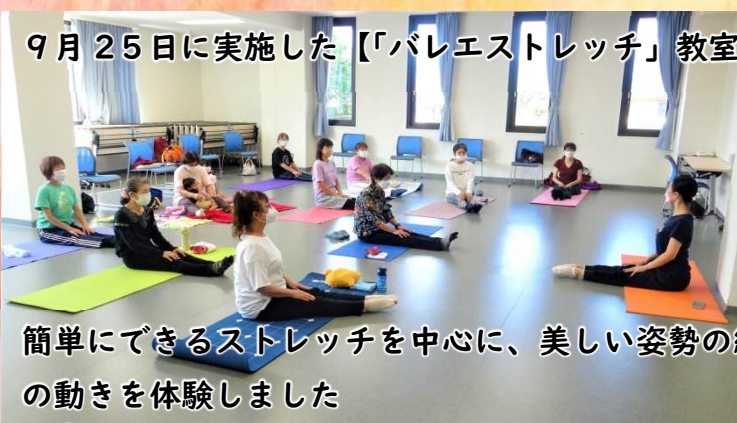
9月25日に実施した【「バレエストレッチ」教室】の様子です。