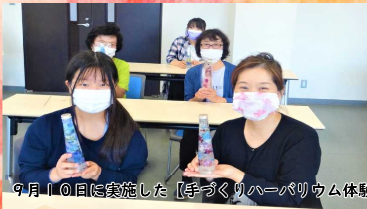
9月10日に実施した【手づくりハーバリウム体験講座】の様子です