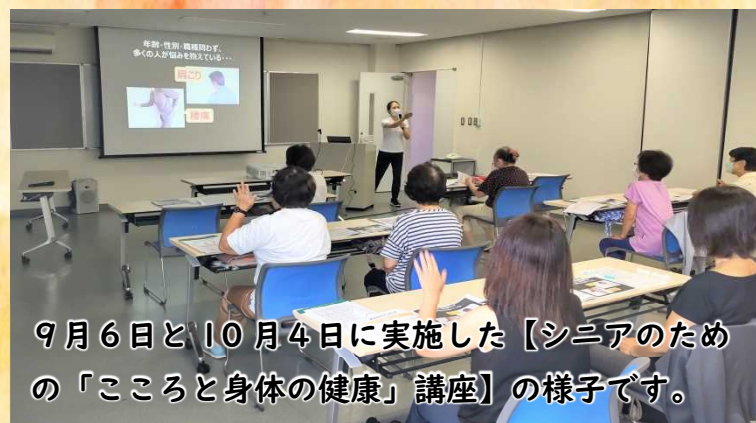
9月6日と10月4日に実施した【シニアのための「こころと身体の健康」講座】の様子です。