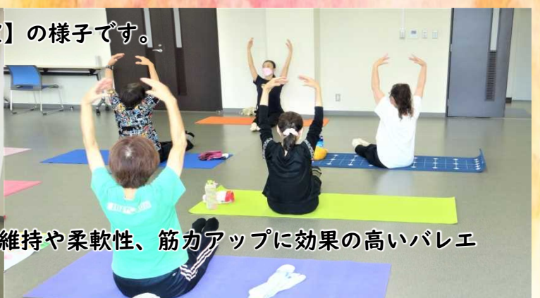
簡単にできるストレッチを中心に、美しい姿勢の維持や柔軟性、筋力アップに効果の高いバレエの動きを体験しました