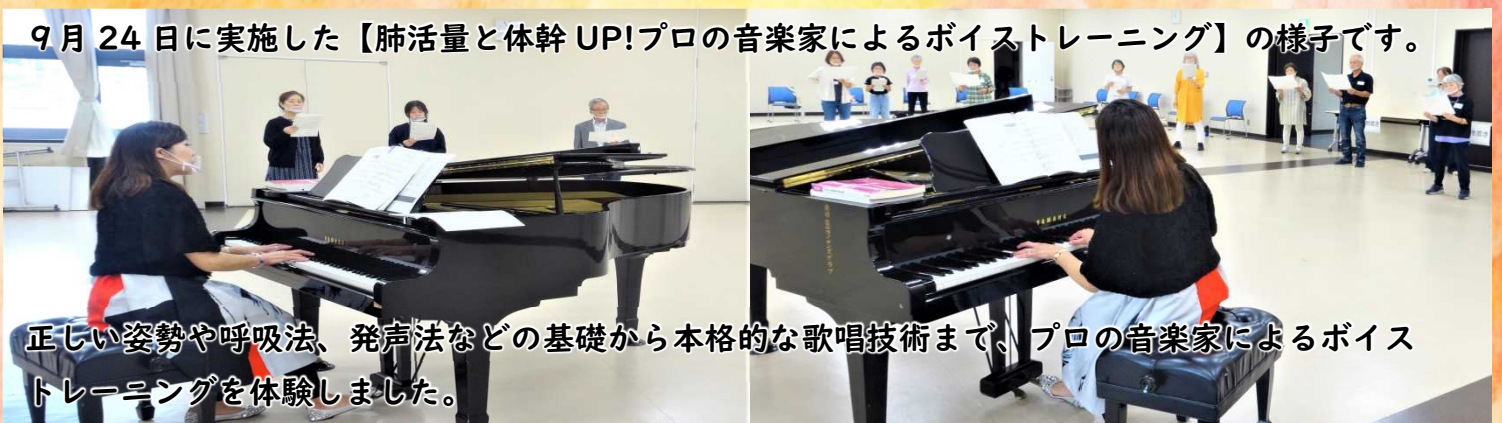
9月24日に実施した【肺活量と体幹UP!プロの音楽家によるボイストレーニング】の様子です。