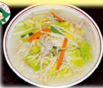
タンメン 630円 (税抜き)