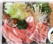
ワイントンしゃぶしゃぶセット 2,200円 (税込)

ワイントンのとんこつスープでしゃぶしゃぶ をお楽しみください。雑味をとっているの で、くせもなく誰でもおいしく召し上がれます。