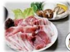
ワイントン焼肉セット 2,200円 (税込)

ワイントンのとんこつスープでしゃぶしゃぶ をお楽しみください。雑味をとっているの で、くせもなく誰でもおいしく召し上がれます。