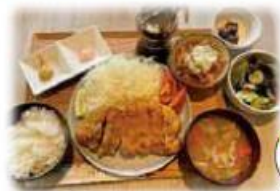
とんかつセット 1,700円 (税込)

ワイントン専門店として全国初 のお店です☆ セットにはサラダ、 モツ煮、小鉢がつきます。どのセッ トも食べ応えがあります。