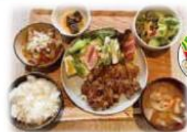
ポークソテーセット 1,700円 (税込)