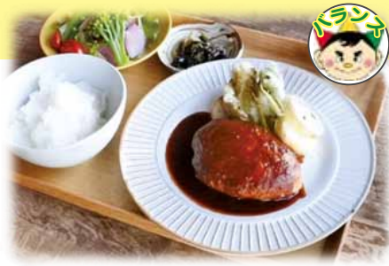
ワイントンのハンバーグの ランチセット 1,300 円 (税込)