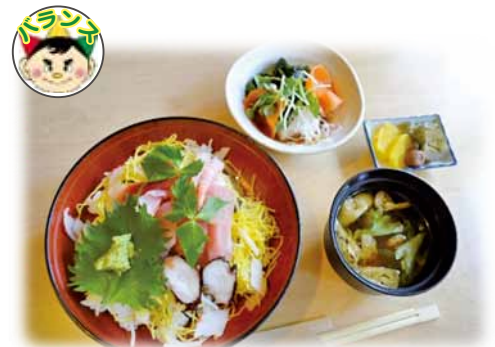
海鮮五目ちらし寿司 850 円 (税込)

開店 10 年変わらない人気メニュー。天丼は濃厚な特製タレと木のサクサク感が絶妙。