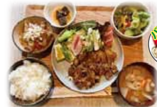
ポークソテーセット 1,700 円 (税込)