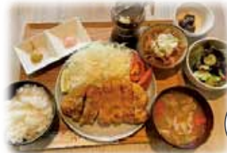
とんかつセット 1,700 円 (税込)