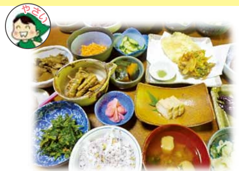
沢楽 (さわら) 定食 2,000 円 (税込)