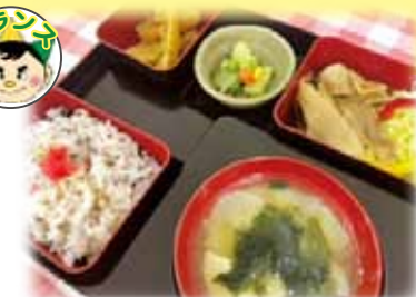
生姜焼き弁当 800円(税込)