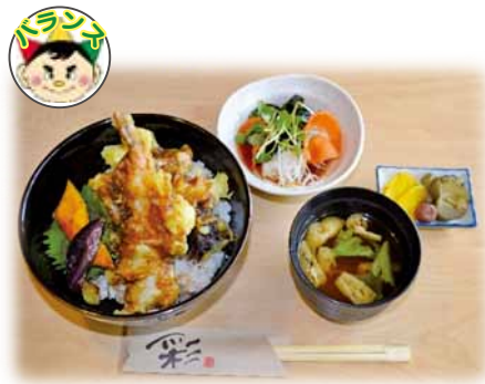
大海老2本と野菜の天丼 850 円 (税込)