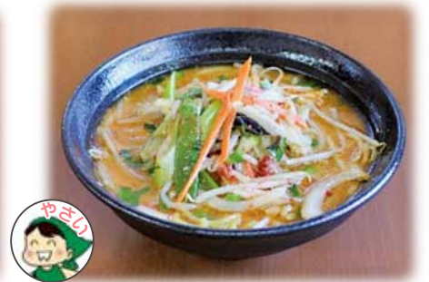
辛味噌タンメン 1,012 円 (税込)

人気の味噌味には自家製味噌を使っています。 どちらのラーメンにも野菜がたっぷりです。