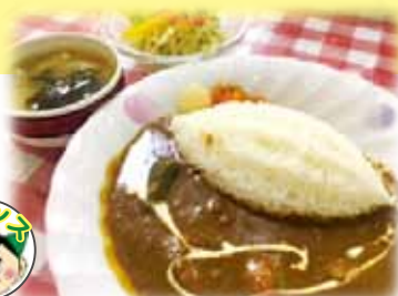
ちよい辛カレー 900円(税込)