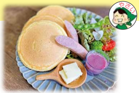
パンケーキのランチセット 1,100 円 (税込)

国産小麦と地元の卵を使用した、 もっちりパンケーキとたっぷり野菜 のランチプレートです!!