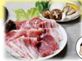
ワイントン焼肉セット 2,200 円 (税込)

ワイントンのとんこつスープでしゃぶしゃぶ をお楽しみください。雑味をとっているので、 くせもなく誰でもおいしく召し上がれます。