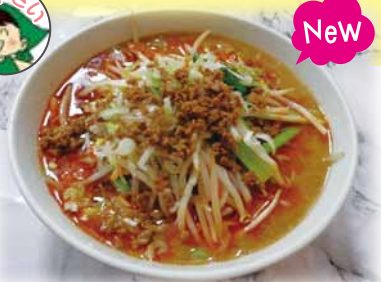
野菜たっぷり担々麺 950円(税込)