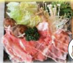
ワイントンしゃぶしゃぶセット 2,200 円 (税込)

ワイントン専門店として全国初の お店です☆ セットにはサラダ、 モツ煮、小鉢がつきます。どのセッ トも食べ応えがあります。