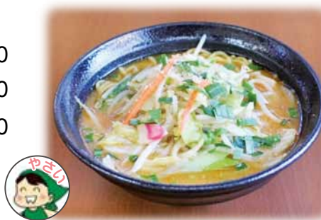
野菜ラーメン (味噌、塩、醤油) 各 957 円 (税込)