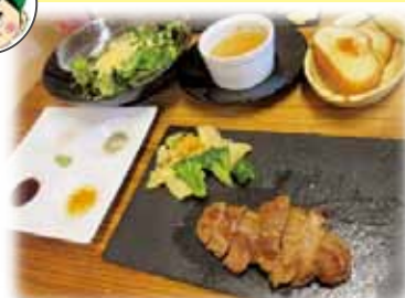
グリルセットイベリコ豚 2,300円(税込)