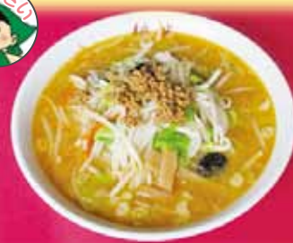
野菜たっぷりみそラーメン 980円(税込)