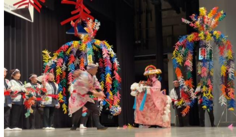
【一之瀬高橋の春駒(山梨県指定 無形民俗文化財)】