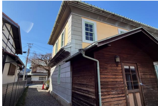
【国登録有形文化財 旧田中銀行社屋(旧田中銀行博物館)】