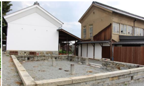
【 東三番蔵解体跡 】