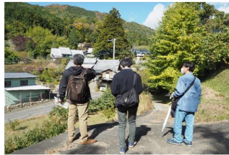
【日本遺産・世界農業遺産認定 ぶどうとワインのまちを巡る勝沼フットパス】 開催日: 令和7年9月21日、10月4日