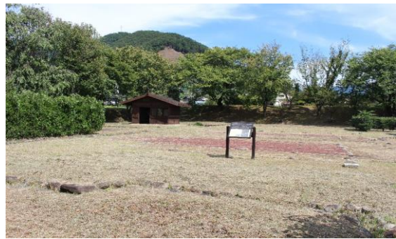
【国史跡 勝沼氏館跡 内郭】