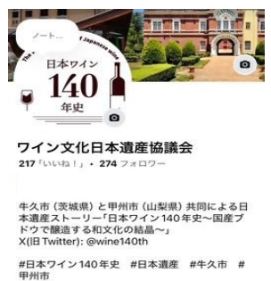
【Facebook】ワイン文化日本遺産協議会