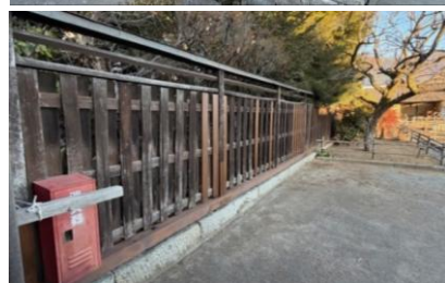
【重要文化財旧高野家住宅 南・西塀改修】