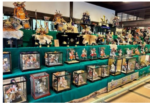
【甘草屋敷 五月飾り展】 (令和7年5月3日～6月2日)