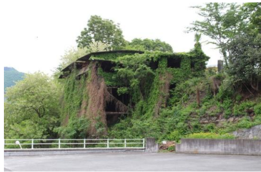
【宮光園 旧展望台(バーベキュー棟)】

宮光園敷地北側斜面に所在し、倒壊の危険がある旧展望台(バーベキュー棟)の解体を検討した。