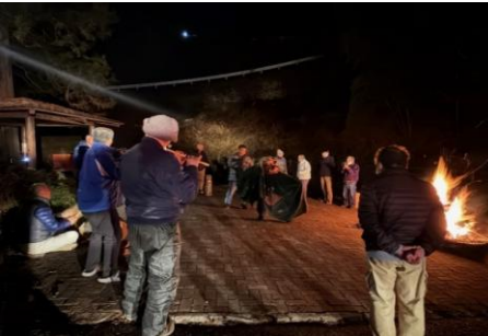
【田野十二神楽(山梨県指定 無形民俗文化財)】 実施日: 令和8年1月17日