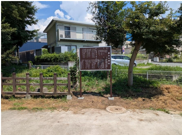
【菅田天神社】説明板