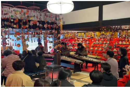
【第24回甲州市塩山桃源郷ひな飾りと桃の花まつり】