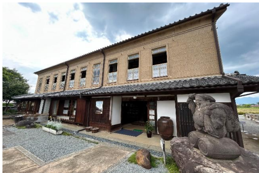
【市指定文化財 宮光園】