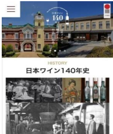
【日本遺産ホームページ】