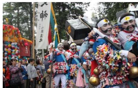
【熊野神社御幸行列(甲州市指定 無形民俗文化財)】 令和7年度未実施