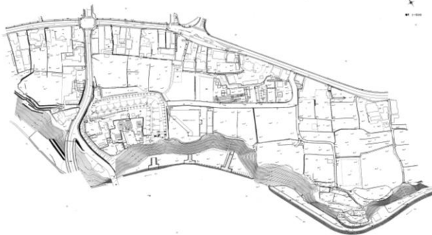
【国史跡 勝沼氏館跡 全体図】