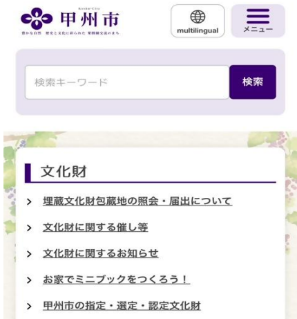
【ホームページ】甲州市