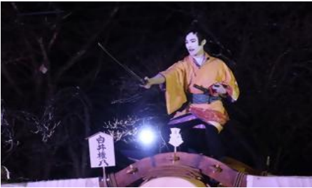
【藤木道祖神祭太鼓乗り(甲州市指定 無形民俗文化財)】