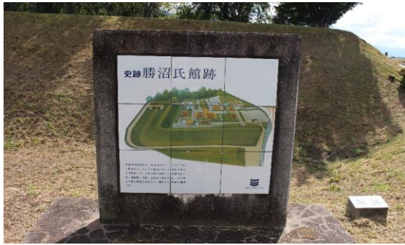
【国史跡 勝沼氏館跡 案内板】