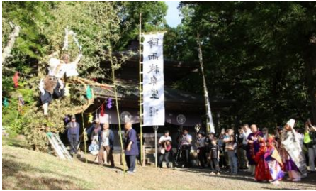
【柏尾の藤切祭 (山梨県指定 無形民俗文化財)】