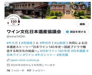
【X(旧Twitter)】ワイン文化日本遺産協議会