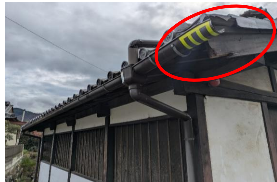
【県指定有形文化財 旧宮崎葡萄酒醸造所施設】 <修理予定箇所>