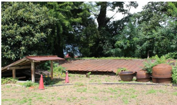
【 第一醸造所葡萄酒貯蔵庫 】