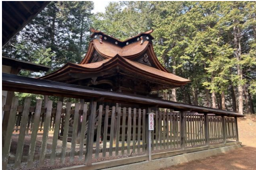
【県指定文化財 金井加里神社本殿】