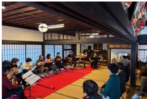
【甘草屋敷 秋のマンダリンコンサート】 (令和7年11月24日)