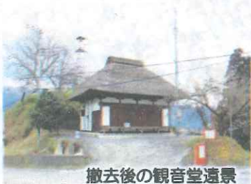
撤去後の観音堂遠景