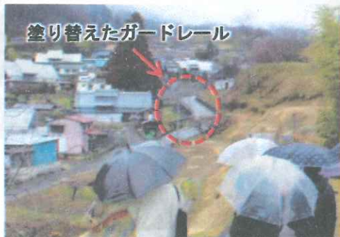
塗り替えたガードレール

当日はあいにくの天気でしたが、市内外から十四名の方にご参加をいただきました。三月五日（日）に開催した「上条集落のガードレール塗り」で、白く目立つガードレールを「甲州ブラウン」に塗り替え、今回の見学会ではさらに美しくなった集落を見学していただきました。