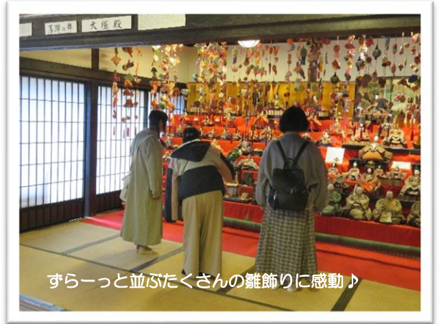
ずらーっと並ぶたくさんの雛飾りに感動♪

春の甲州を満喫する旅！3人とも笑顔いっぱい楽しく撮影をすることが出来ました。甲州市を思い切り楽しむ観光PR動画が作れたと思います☆