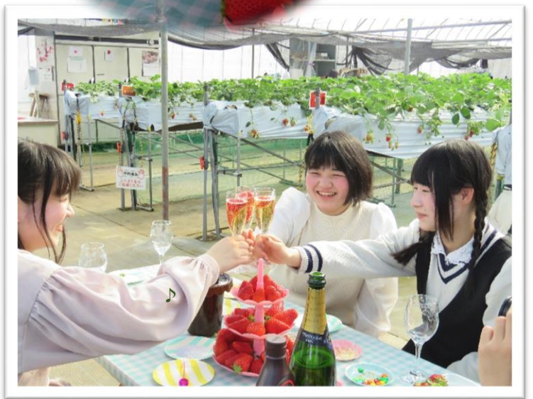
シャンパンにいちご 可愛いしおいしい♡