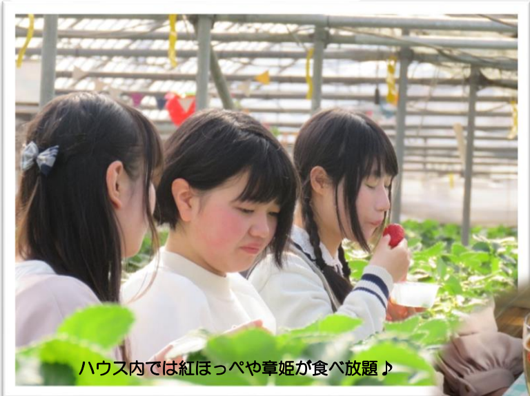
ハウス内では紅ほっぺや章姫が食べ放題♪