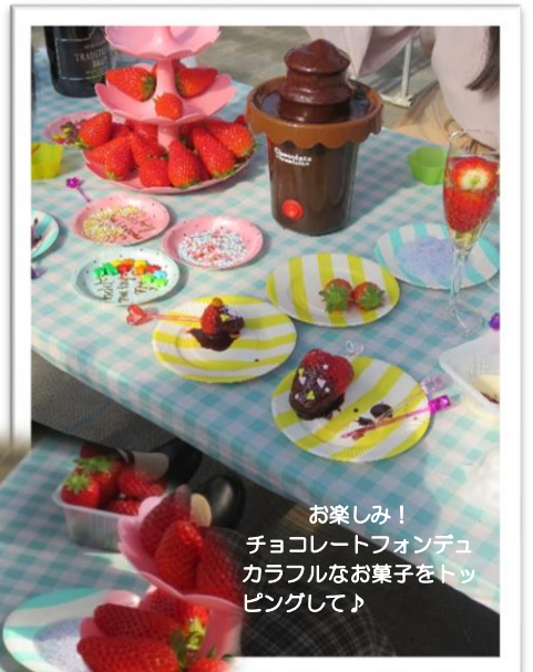
お楽しみ！ チョコレートフォンデュ カラフルなお菓子をトッピングして♪