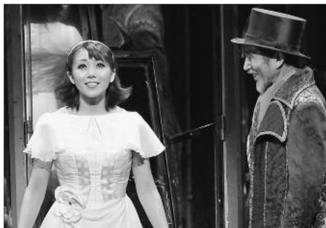
劇団四季の入場券は現在販売中！