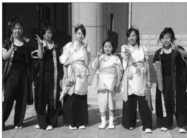
風林火山塩山太鼓の皆さん