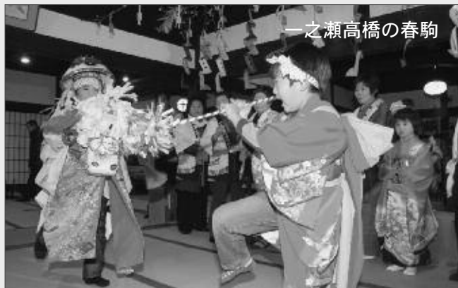
一之瀬高橋の春駒