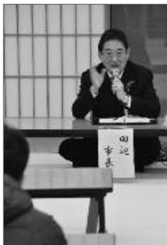
市民懇談会を開催