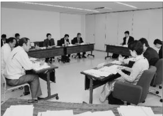
市民の納得度が高まる行政サービスの提供を目指して、業務仕分け（第三者評価）、窓口業務などを取り組んでいます。