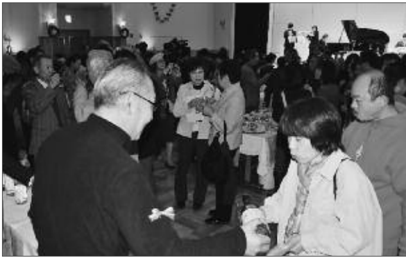
特産ワインを味わいクリスマス気分を満喫

甲州青年会議所と甲州市教育委員会は12月12日、大和まほろば会館で第4回まほろば・ほろ酔いクリスマスコンサートを行いました。クラシックの感動した後に、ジャズに合わせて特産ワインを味わった参加者は、ちょっぴり早いクリスマスを楽しんでいました。