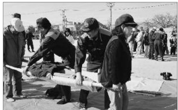
塩山消防署の指導による応急訓練

塩山地区の下中区と下西区は11月28日、塩山南小学校校庭で合同防災訓練を行いました。隣接する区民が共通した防災意識を持つことを目的に、塩山消防署から災害時に役立つ応急措置などを学び、社会福祉協議会の協力体制の確認など、参加者は真剣に訓練をしました。