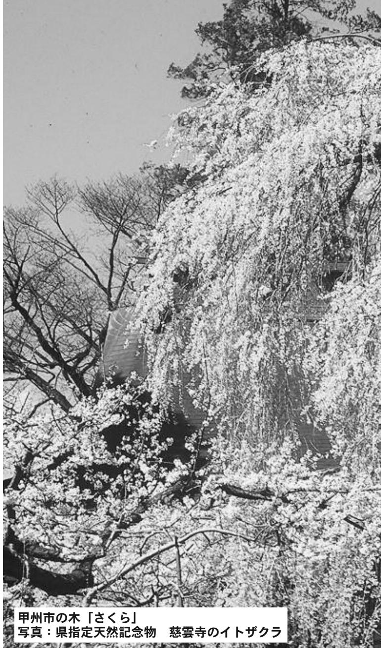
甲州市の木「さくら」 写真：県指定天然記念物 慈雲寺のイトザクラ

私は、常に市民の皆様との対話を心掛けております。市民の皆様が主役となった甲州市づくりのために私は、市内各地域で「こうしゅう市民懇談会」を開催し、各会場では、将来にむけて様々なご意見やご要望をいただき、皆様との意見交換から新しいまちづくりへの手掛かりが生まれています。 また、笑顔が行き交う市民交流においては、市民一人ひとりが共通目標のもとで将来にむけて歩んでいくことが大切であると信じております。