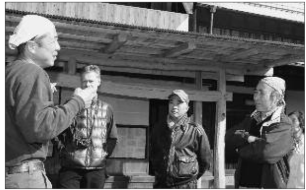
甲州民家について説明を聞く参加者

日本民家協会は11月27日、甲州市内の民家を巡るツアーを行いました。「地域文化により生まれた甲州民家に感動しました」と地元職人が語る甲州民家の説明に、県内外から参加した皆さんは耳を傾け、また記録写真を撮るなど、それぞれに甲州文化に触れていました。