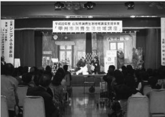
演劇を通じて楽しく学習する参加者のみなさん

当日は、具体的な事例を挙げて説明された「消費者を狙う悪徳商法と、その対処法」の講演と、シニアふる里劇団のみなさまによる楽しい演劇を通じて、多くの参加者が学習する機会を得ました。