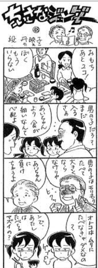
C段丹映子・「週間長野」掲載・無断転載禁止

※申請用紙は、市ホームページからダウンロードできます。 ◆申し込み・お問い合わせ先 甲州市農業委員会 事務局 産業振興課 農地担当 ☎32・5092