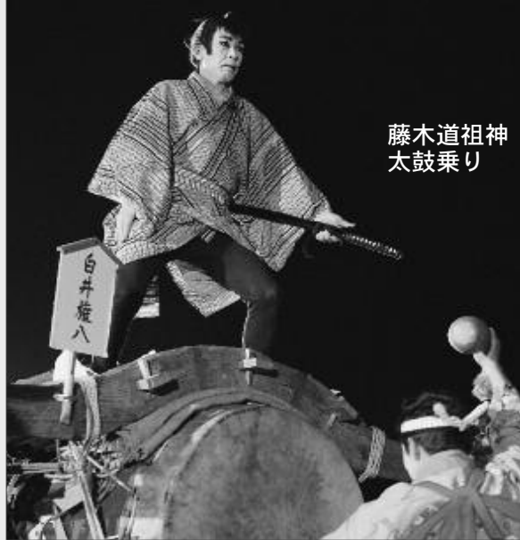
藤木道祖神 太鼓乗り

甲州市には、地域住民により伝承されてきた大切な文化があります。中でも「藤木道祖神太鼓乗り（1月14日・放光寺駐車場）」「田野の十二神楽（1月15日・田野集会所）」「一之瀬高橋の春駒（1月15日・甘草屋敷）」は、代表的な小正月行事として知られています。今年も、地域住民により盛大に行われる伝統文化を実際にご覧いただき、先人の心を感じてください。