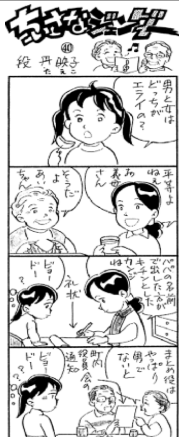
C段丹映子・「週間長野」掲載・無断転載禁止