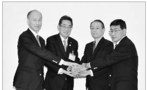
森林保全の協定を結び、しっかり握手！