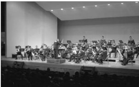
会場全体を魅了した陸上自衛隊第1師団の演奏

甲州市教育委員会では2月12日、市制施行5周年記念事業として陸上自衛隊第1師団と自衛隊山梨地方協力本部の協力により、「甲州市ふれあいコンサート」を市民文化会館で開催しました。当日は、全国で有名な陸上自衛隊第1音楽隊の演奏を聞こうと、昨日からの降り積もる大雪にもかかわらず会場は満席。2部構成で行われたクラシックやポップスなど幅広いジャンルの名曲演奏は、心地良い音色に「うっとり」、時には躍動感あふれる迫力に会場全体が魅了されました。