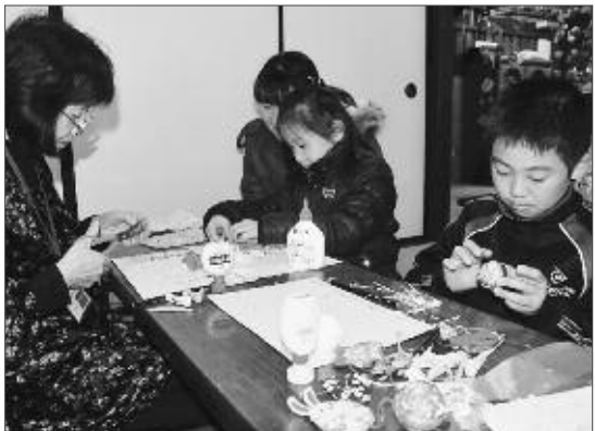
「楽しいね」と甘草屋敷内で開催のつるし飾りづくり体験教室