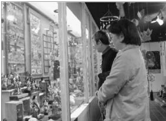
「豊富だね」と信玄公宝物館は数多くの紙雛や御殿雛等が展示

し飾りづくり体験教室(有料)では、自分だけのオリジナルつるし飾りを作ろうと、家族や友達など多くの皆さんが体験をしています。