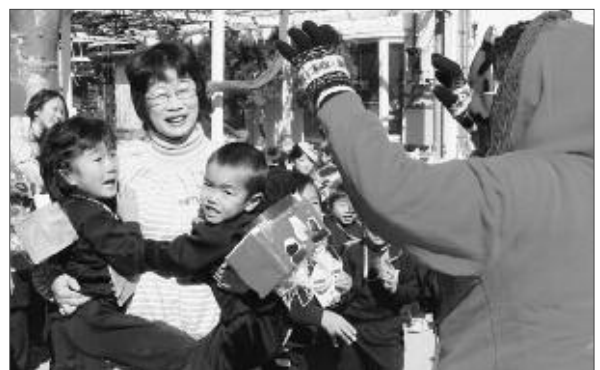
「こわいよ～」と先生に抱きつく園児

2月3日は節分の日。この日は市内各地で豆まきなど節分行事が行われました。塩山愛育園では、園児たちが鬼のお面を作り、年男・年女役の園児が豆まきを行いました。その後、園児らはワクワク・ドキドキしながら「最強の赤鬼」が来るのを待っていました。すると・・・いきなり赤鬼が登場！大きな声で泣き叫ぶ幼少の園児らに、お兄さん園児らが「助けにきたぞ。鬼は～外」と、いっぱい豆を投げつけて鬼を撃退しました。園児みんなの協力で福の神を迎え入れていました。