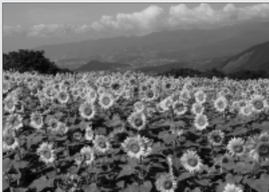
約5万本のヒマワリ畑は新名所として多くの方が楽しんだ

会では、耕作放棄地の有効活用を目的に、昨年からの菜の花の種をまくなど事業を展開してきました。満開となったヒマワリ畑は、市内外から多くの見物客が訪れ、花を摘むなど楽しいひと時を過ごしていました。