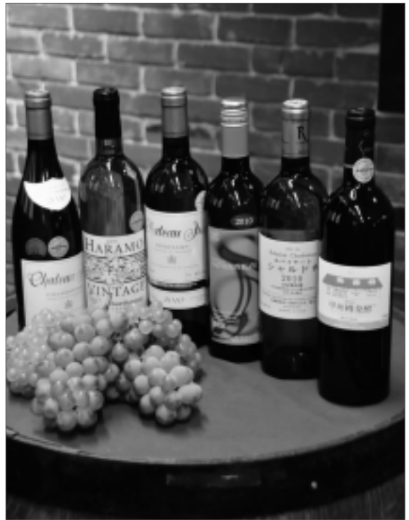
日本ワイン発祥の地に誕生した認証ワイン

今回認証したワインには「GROWN IN KOSHU CITY」と示したシールが貼られ、勝沼ぶどうの丘などで販売をしています。公開テイスティング会に参加した皆さんは「ブドウの産地だからできる制度。栽培者と醸造家など地域住民と行政が連携して育ててほしい」と認証制度に期待を寄せていました。