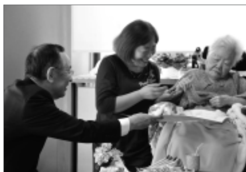
田辺市長や横内知事は新百歳の慶祝訪問を行い長寿を祝いました