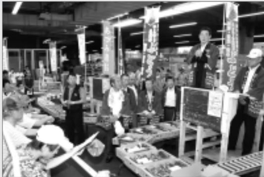
特産ブドウを積極的にPRする田辺市長

特産ブドウを味わった市場関係者は、「産地らしく味がしっかりしている」との好評から、当日の取り引きは高価格で行われ、早々にトップセールスの成果が表れました。