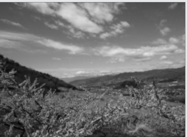
地域景観は私達の宝（大藤地域から見える桃源郷）