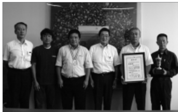
全国準優勝を報告した塩山クラブの皆さん