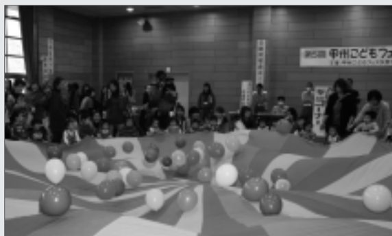
昨年子どもフェスタ

◆お問い合わせ先 甲州市子どもフェスタ実行委員会 事務局 子育て対策課 ☎32-5081