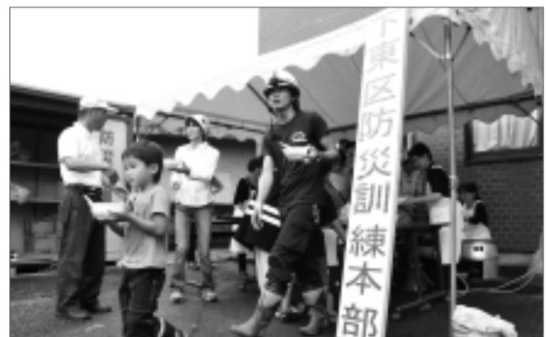
炊き出し訓練も行った塩山下東区の防災訓練

3月に発生した東日本大震災の教訓から、今年は多くの参加者が集まり、地元消防団員の指導のもと、初期消火訓練や応急手当、AED（自動体外式除細動器）の使用方法など、様々な訓練が行われました。参加者からは「震災のための確認と地域住民の連携が重要です」との意見が出るほど、震災から身を守る心構えと準備を再確認していました。