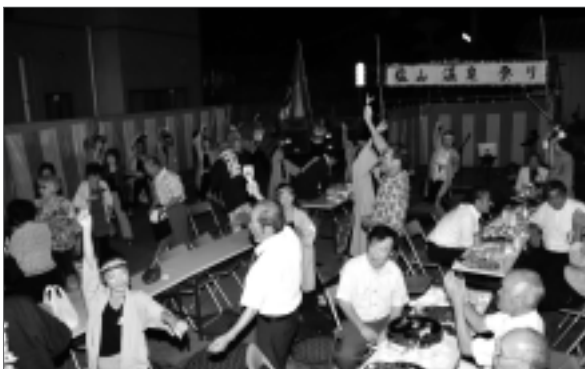
盛大に行われた塩山温泉まつり

祭りには、多くの皆さんが集まり、歌や踊りを披露するなど、温泉の恩恵に感謝すると同時に地域の発展を願っていました。