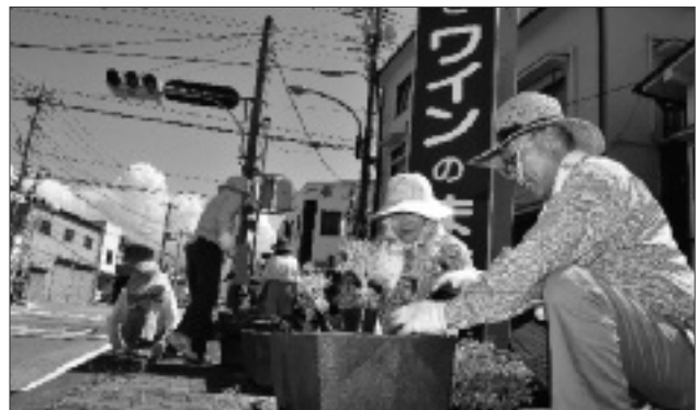
1株ずつ心を込めて花植える花のボランティアグループの皆さん（7月10日）

活動開始から24年目を迎えた現在でも、自治公民館の皆さんの協力により、勝沼町全域が