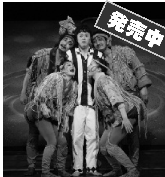
※写真提供 荒井健 (撮影)