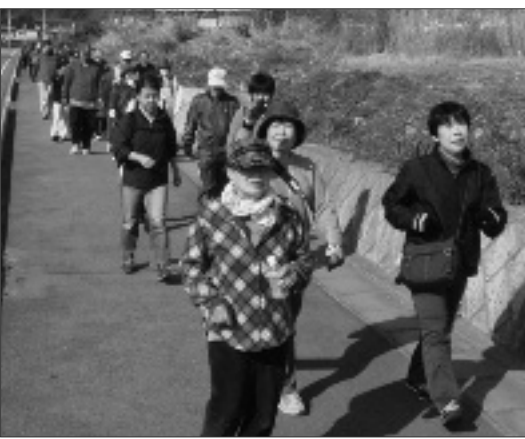
歩くいて秋の甲州市を満喫してみませんか