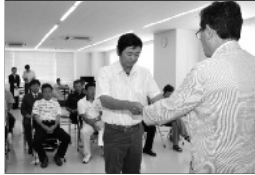
田辺市長から委嘱を受けるアグリマスターの皆さん

甲州地域協働協議会（NPO法人コロポックル、NPO法人甲州元気村）が持つ特性を相互に活かすため、協力隊員を加入させることにより、地域への貢献を高めることを目的としています。