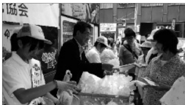
約300名に旬の桃を無料配布しました。