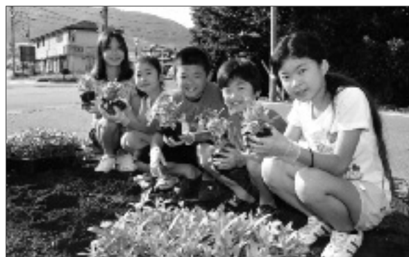
きれいに咲いてねと願いを込めていました。

小佐手の交差点は、勝沼ぶどうの丘や市内の観光名所などにつながる幹線道路として、多くの観光客が通ることから、「多くの皆さんに見てもらい、勝沼を楽しんでもらいたい」と子供たちは笑顔で話しました。