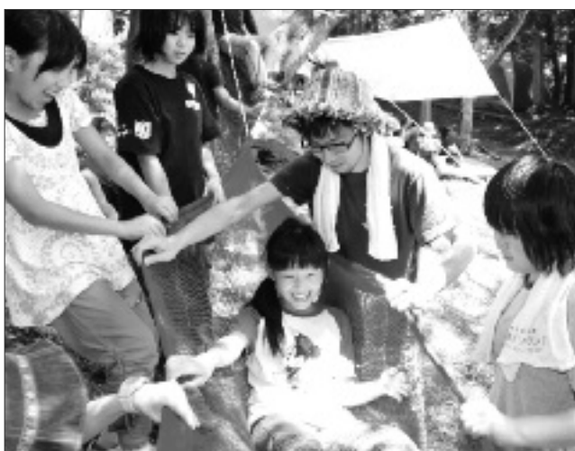
自然の中で笑顔で楽しむ皆さん

7月16日から3日間、大滝山キャンプ場で勝沼町内の小学校6年生、93名が参加して勝沼少年ジャンボリーが行われました。 大自然に囲まれて、テントの設営や食事づくりなどに挑戦した児童は「たのしく」と元気がいっぱい。 9班に分かれての生活は、キャンプファイヤーなど自然を利用した遊びに、すぐに友達の輪が広がりました。 「自然の中で仲間と心で向き合い、子供達ら