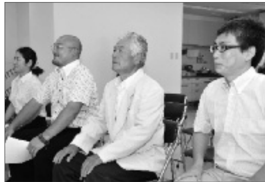
委嘱式に出席したNPOの代表と協力隊の皆さん