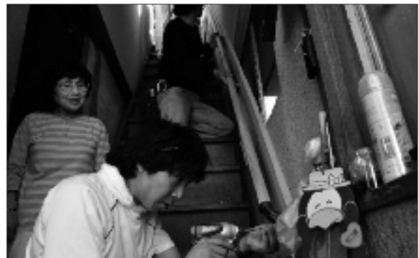
訪問先で手すりを取り付ける組合員の皆さん

「本当にありがとうございます」と訪問先の皆さんが感謝するように、組合員の手際の良い作業で、使いやすく、心地よい住宅になりました。また、作業が終わると組合員は「お互い元気で頑張っていこうね」と声をかけ、親睦を深めました。