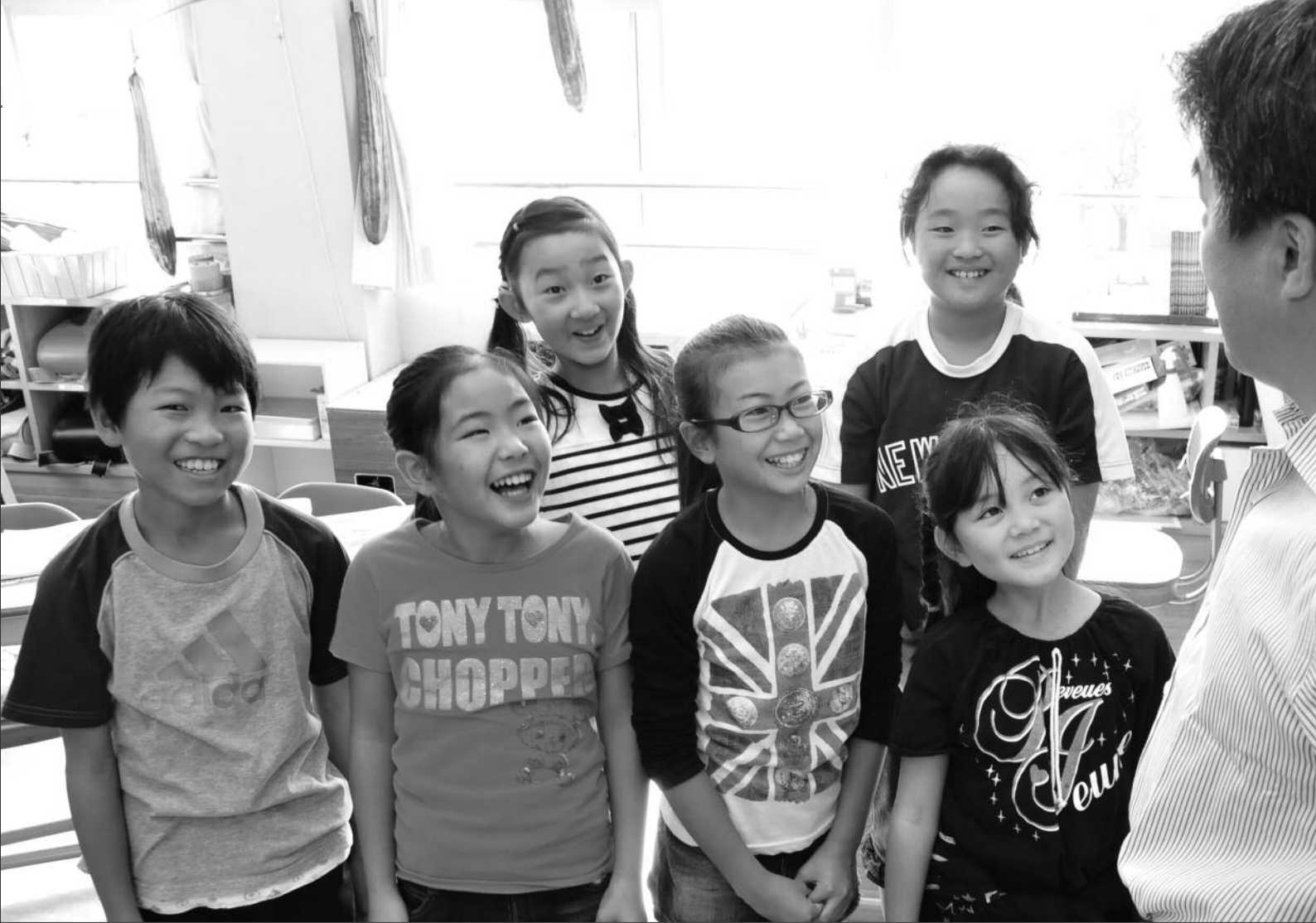
いつも笑顔で会話を楽しむ菱山小4年生の皆さん