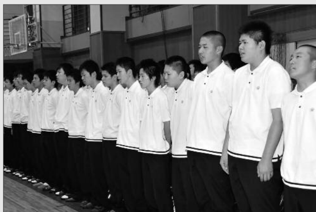
84名の1年生全員は初めて母校の校歌を合唱。（塩山高校）

塩山温泉郷での宿泊、ブドウ狩りなどで一緒に過ごした日々には生徒らは、「同級生全員で初めての思い出となりました。」と、今回の研修旅行を支援してくれた多くの皆さんに感謝をしていました。