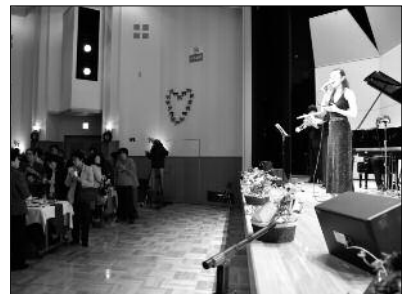
昨年のコンサート