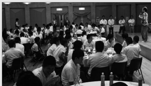
甲州青年会議所や甲州すけっと隊などが歓迎会でお出迎えをしました。（勝沼ぶどうの丘）