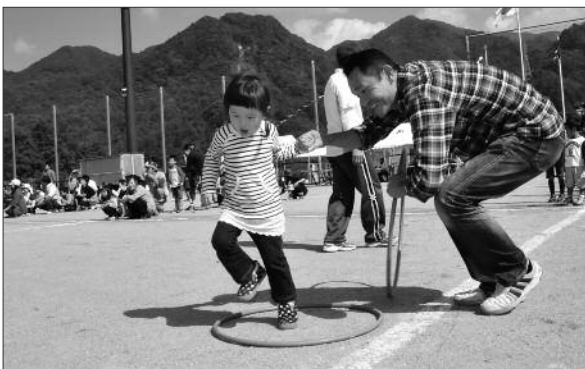
運動会を通じて住民間の絆が深まりました。

秋晴れの下、運動会を通じて会話も弾み、世代を超えた住民間の交流、そして地域の絆が深まりました。