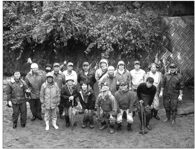
産卵場所の設置作業に参加した皆さん

まずは、大きな石を川の外に運び出し、丸太で川の流れを緩やかにしました。そこに、魚が産卵しやすく砂利などで整備をしました。今年は台風などの影響により、予想以上に川の中が崩され、作業当日も雨が降り、足場も厳しい状