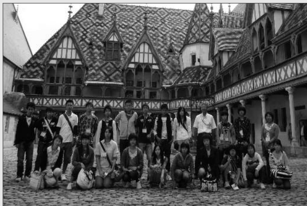
フランス・ポーヌ市で心の交流を深めてきた訪問団の皆さん（オスピス＝ド＝ポーヌ）

ポーヌ市は、甲州市と同様に、ブドウの栽培とワインの醸造を中心とした産業の歴史があります。中学生訪問団の皆さんは、最初は言葉や文化の違いをはじめ、不安なことだらけのホームステイでした。しかし、ホストファミリーの優しさに触れ、寝食をともにしながら、お互いを思いやった心の交流を通じて、自然と本当の家族のようになりました。団員の中には、覚えたてのフランス語で会話が弾むようになりました。今回の訪問により「フランス文化を通じて、様々な発見と世界の文化に興味が増えました」という声も聞かれ、交流を通じて、人と人で世界が結ばれていることを実感することができました。