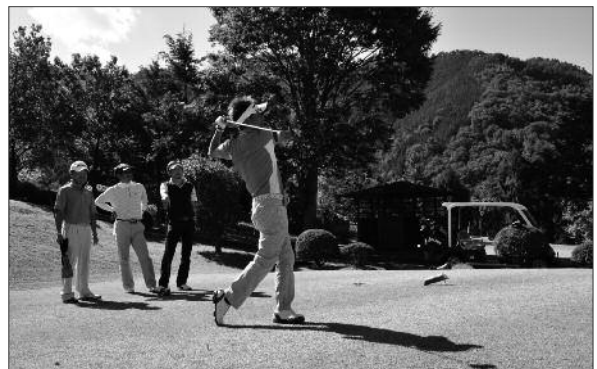
ナイスショット！笑顔でゴルフを楽しむ参加者