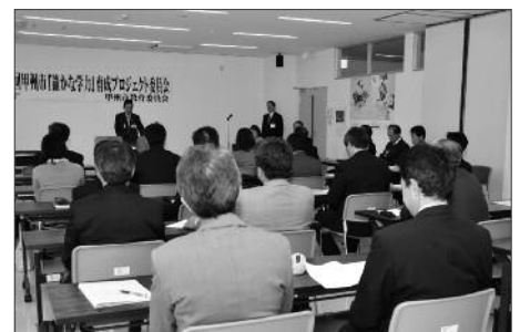
小・中学校など各教育機関で設立した「確かな学力・育成プロジェクト」

そこで、平成23年10月11日から平成25年8月までの2年間で取り組む「甲州市・確かな学力育成プロジェクト」を