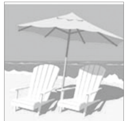
夏の海に遊びに行こう!