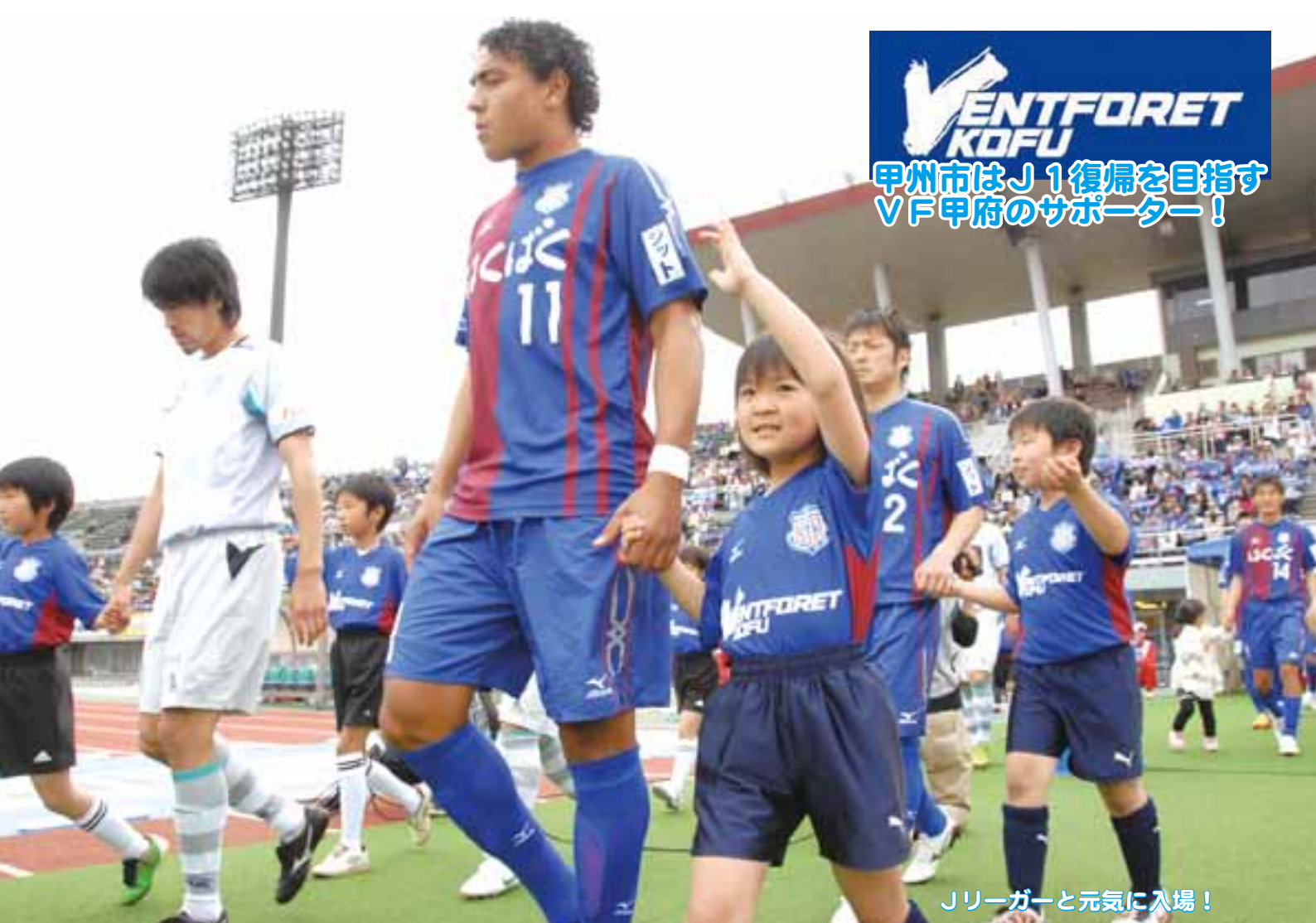
Jリーガーと元気に入場！