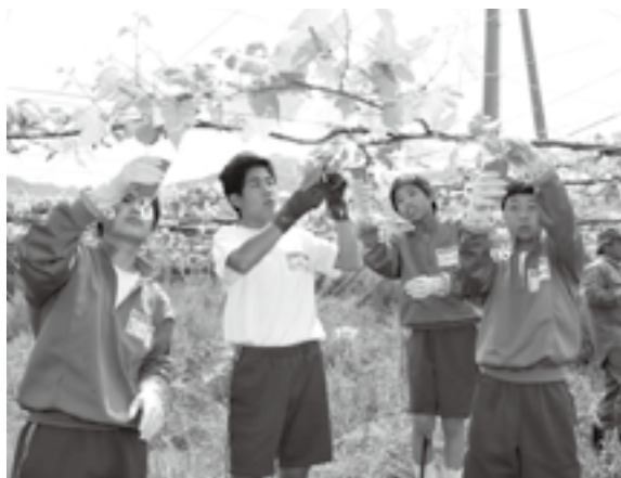
ぶどう栽培を通じて産地の素晴らしさを体験

この実習は、学校活動の一環として行われ、市の基幹産業であるぶどう栽培について理解し、農作業体験による勤労の尊さや奉仕の心を培うことを目的に昭和43年から実施しています。「美味しいぶどうになってね」と生徒の皆さんは、ジベ処理作業を通じて、産地の素晴らしさを感じていました。