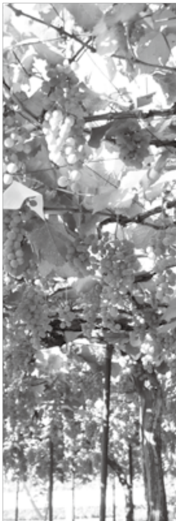
高品質の果実は甲州市の宝