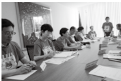
田辺市長と意見交換する推進委員の皆さん

男女共同参画の推進月間である今月の広報では、改めて男女共同参画社会を再確認して、活力ある心豊かな地域づくりを考えてみました。