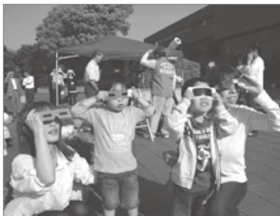
多くの皆さんが歴史的瞬間を観察しました。 (写真上 奥野田小・写真下 市民文化会館)