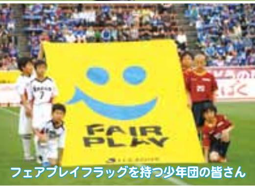
フェアプレイフラッグを持つ少年団の皆さん