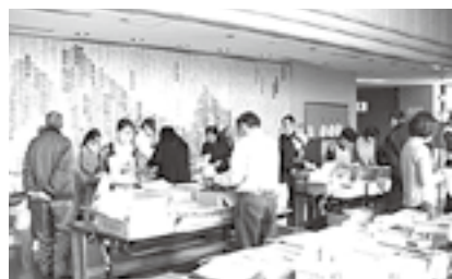
『塩山図書館ブックフリーマーケット』