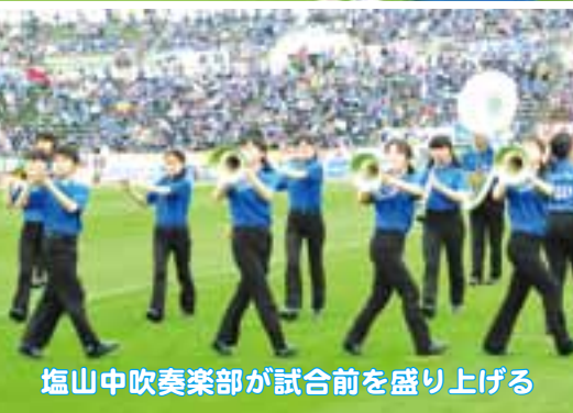
塩山中吹奏楽部が試合前を盛り上げる