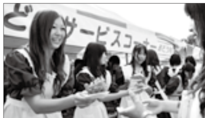
甲州市をPRする フルーツ娘