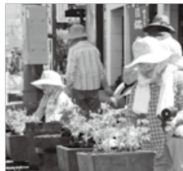
川ある～き（写真上）河川清掃（写真中）花植え活動（写真下）