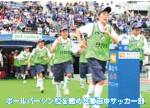
ボールパーソン役を務めた勝沼中サッカー部