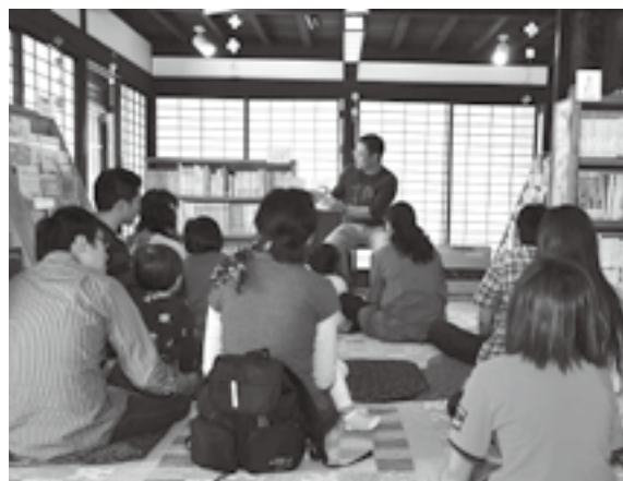
読み聞かせをするお父さん

普段ふれあうことの機会の少ないお父さんが、絵本の読み聞かせやわらべ唄に挑戦。いつもとちがうお父さんの表情とお話に「かっこいい」と子ども達は上機嫌で聞いていました。「この機会に、家でも読み聞かせをやってみよう」と参加したお父さん達も笑顔で話すなど、読み聞かせを通じて、親子の楽しいひと時を過ごしていました。