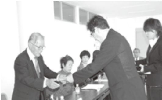
田辺市長から委嘱を受ける委員の皆さん