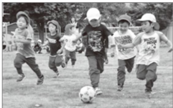
ボールを追いかける園児たち親子ラグビー (東雲保育所) (塩山カトリック幼稚園)

親子でラグビー遊びにチャレンジ、腰にタグを付けての鬼ごっこでは、普段親子一緒に体を動かすことが少ない園児は大興奮。ラグビーボールを運ぶゲームでは親子力を合わせ、タグを取られないように一生懸命ボールを運んでいました。親子の絆を深めるレクレーションになりました。