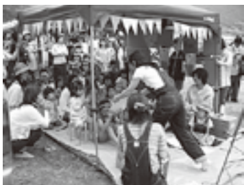
『塩山図書館ブックフリーマーケット』