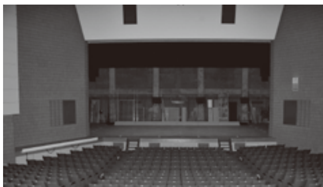
中央公民館大ホール

また、給食調理場の整備につきましても、各検討委員会及び教育委員会が基本計画が示されたので、今年度はそれを基本に実施設計に入りました。 今後、用地等の購入と許認可申請業務を進め、平成25年度には建設工事に着手したいと考えております。 中央公民館大ホールの舞台設備リニューアル工事につきましては、10月末の完成を目指し工事を実施し、平成25・26年度実施予定のリニューアル工事は、現在、詳細設計業務委託の発注に向け準備を進めているところであります。