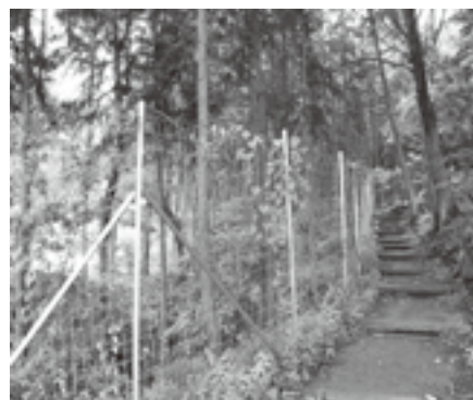
計画的に防護柵設置事業を実施