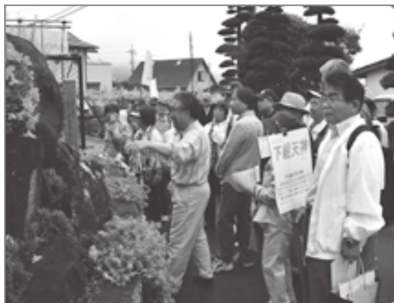
地元の文化財を再発見

文化財の前ではその由来などを説明するなどし、ただ歩くだけではない、新たな試みに参加した方々も、「こんなところにこんな文化財が」と口々に言っていました。地域を再発見するよい機会でもありました。