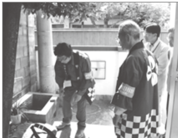
点検を行う、水道協力会員

「水道のことで困っていることはありませんか」と訪問先で声をかけ、水道の蛇口のチェックなどの無料点検活動に、「本当にありがたいですね」と高齢者は感謝の言葉をかけていました。また、この日は、水道事業の理解促進を呼びかける啓発活動を市内JR3駅で行いました。