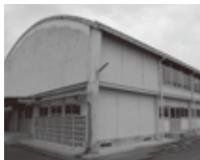
塩山北中屋内運動場

年次計画で行っている校舎等の耐震整備事業であります。本年度は奥野田小学校西館、松里小学校特別教室棟、塩山中学校南館の耐震補強工事と塩山北中学校屋内運動場改築工事を行います。また、平成25年度の整備に向け大藤小学校屋内運動場、松里小学校屋内運動場、神金小学校屋内運動場耐震補強の実施設計に入り、平成25年度には全て終了する計画で進めております。