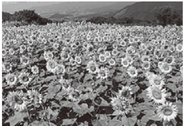
多くの皆さんから好評のヒマワリ畑 (平成23年9月撮影)

近年、全国的な課題といわれる耕作放棄地。甲州市においても平成22年の農林業センサスで240ヘクタールの耕作放棄地があります。