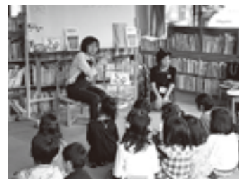
「まーの・あ・まーの」聞こえる子も聞こえない子も一緒に楽しみました♪