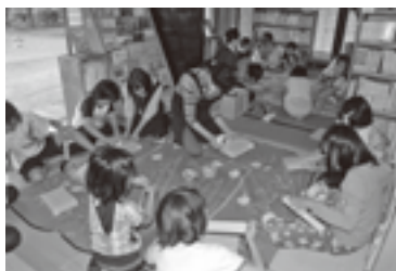
「子ども図書館ワークショップ」ガムテープでかばんを作りました。