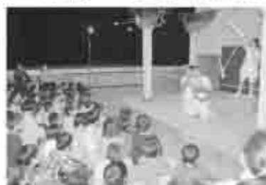
楽しい演劇に見入るちびっこ

「いつても・どこでも・どこへでも」を合言葉とした劇団風の子の公演に、会場に訪れたちびっこなど多くの方は見入っていました。