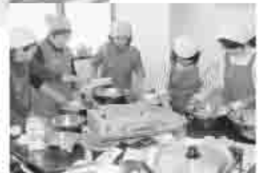
食改さんがレシビを考え、おいしい料理がふるまわれた。

祝公民館では書道や写真、絵画など多くの芸術作品が並び、訪れた方は見入っていました。また、祝小学校グラウンド・体育館では、グラウンドゴルフ、ソフトバレーが行われ、参加者は晴天の下でさわやかな汗を流していました。この日、食生活改善推進員が、すいとんやおむすびなど