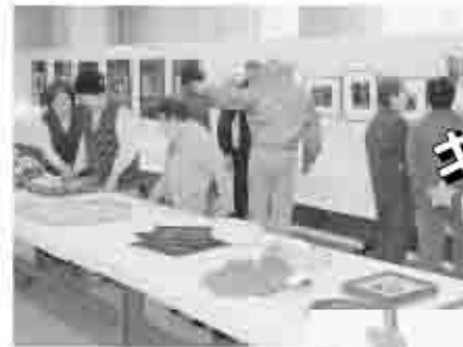
会場に並ぶ芸術作品