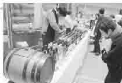
▲ワインを中心に、市の特産品を紹介