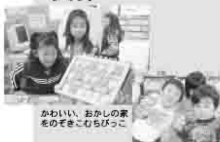
かわいい、おかしな家をのぞきこむらびっこ

勝沼人形劇団「葡萄の実」によるクリスマス特別公演では、人形劇のほか指人形を楽しむなど盛りだくさんの内容で、あっという間に時間が過ぎていきました。子供たちは素敵なクリスマスプレゼントを手にして楽しい時間を過ごしていました。勝沼図書館ボランティアによるおはなし会は真っ暗な部屋で行われ、いつもと違った雰囲気みんなワクワクドキドキしていました。