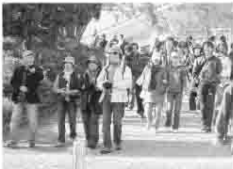
日頃、車を利用することの多い生活。たまには、家族とのんびり歩いてみるのもいいものです。

ら、家族でお互いの歩調を合わせ、ほのぼのとしたふれあいの時間を楽しんでいました。