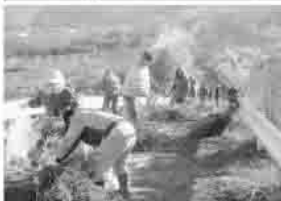
早朝から地域のみなさんで清掃活動を行った。(枯れ草4トトラック2台、缶・ビンなどのゴミ30袋を収集)