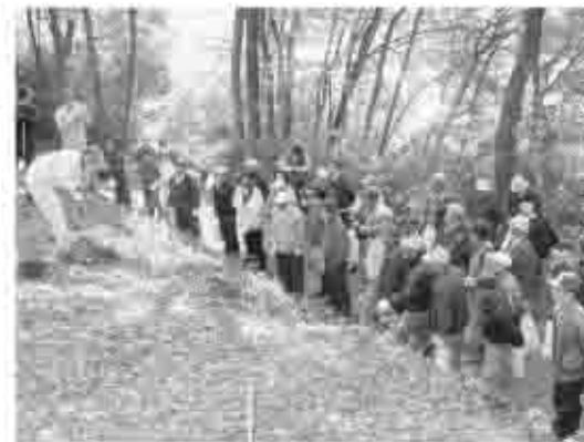
中腹の急な斜面に穴を掘り、百十本の苗木を植えた会員

発足後初めてとなる植樹活動には、会員約80人が参加し病害虫に強い松を含め、百十本の赤松の苗木を植え