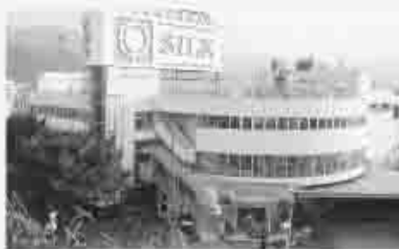
庁舎移転先の旧塩山シヨッピングセンター「シルク」。 検討会により、協議が進められる。