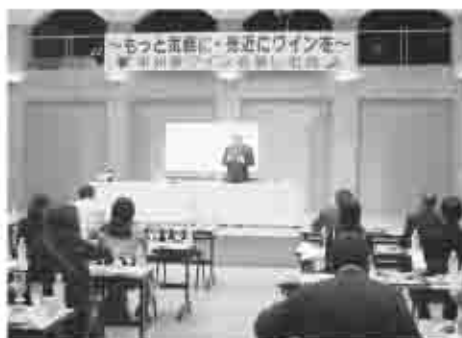
【甲州種ワイン普及推進事業 11/19】市では、地元の方々がワインに親しみをもち、地元のワイン産地を積極的に展開しています。

国内において、「ワイン産地」として確立されつつある地域とは、山梨、長野、山形、北海道などと証されてきました。