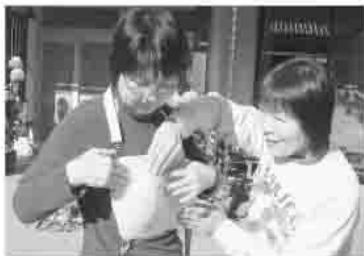
乳房模型で「乳ガン」の手触りを実感し、驚きの様子のお母さん方

「こんな感じなんだねー」「意外にちっちゃいけどこれもガン?」「このくらいが大きさだったら早く医者に行けばいいわくないね」など、