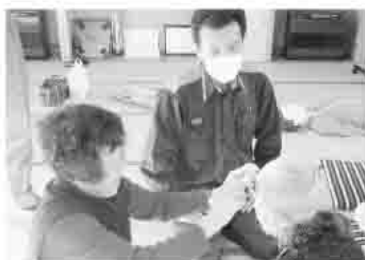
パンストを使いケガの応急処置を消防署の署員から指導していただく班員