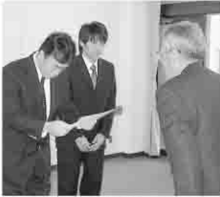
教育長から指定管理者に「指定管理者指定通知書」が手渡されました。