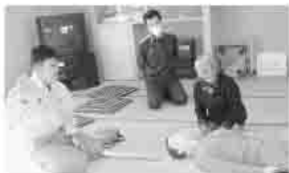
心肺蘇生法を実践

始めの頃は、どんなことをするのか分からず、不安な気持ちで参加していましたが、隊員の方からこと細かに学習内容について説明があり、心肺蘇生法や止血法を人形を使って