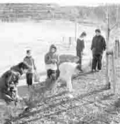
早朝から汗を流し作業する塩山スポーツクラブのみなさん