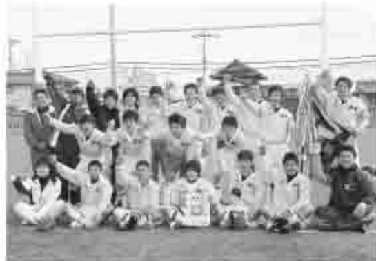
季節部として練習を重ね、新人戦で優勝した勝沼中学校チーム

決勝戦では勝沼中と塩山中学校が対戦。勝沼中が塩山中に26-21の逆転で、劇的な勝利となり初優勝しました。