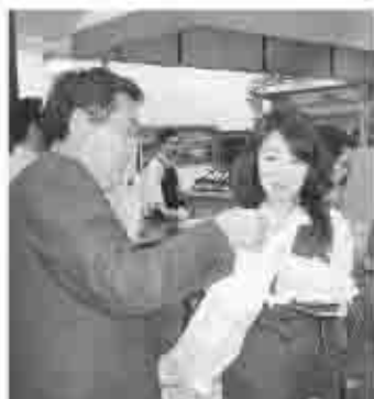
▲山梨県アンテナショップ「富士の国やまなし館」で観光PR

JR東京駅八重洲口の近隣にある山梨県アンテナショップ「富士の国やまなし館」では、山梨県とタイアップし、ぶどうや桃、ワインなどの特産品のPRをはじめとする、甲州市全般の観光宣伝を行っています。