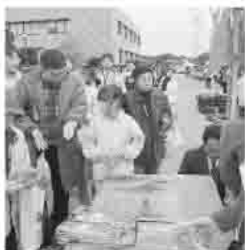
▲姉妹都市千葉県富津市の「産業祭」に出向き、甲州ぶどうを無料サービス。

11月11日には、姉妹都市である千葉県富津市の「産業祭」で「風林火山 武田の聖地 甲州市」として、武田家ゆかりの寺社を紹介するとともに、甲州種ワインなどの観光宣伝活動を行いました。