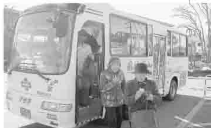
市内をめぐる甲州市縦断線バス

みなさんの生活にお役に立てることを考え、これからもご意見などをお聞きし、親しみある縦断バスを目指していきます。