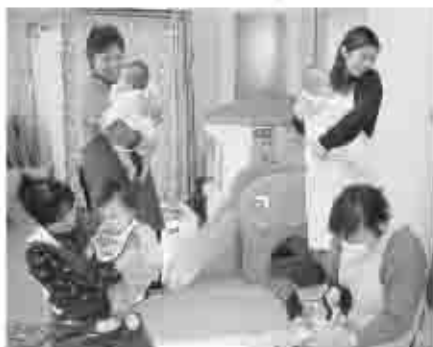
すくすく学級で託児ボランティアし、ふれあいの輪を広げる役員さん

感じ、このような機会が多ければ多い程「情緒が安定」し、よりよい発育発達につながると言われています。