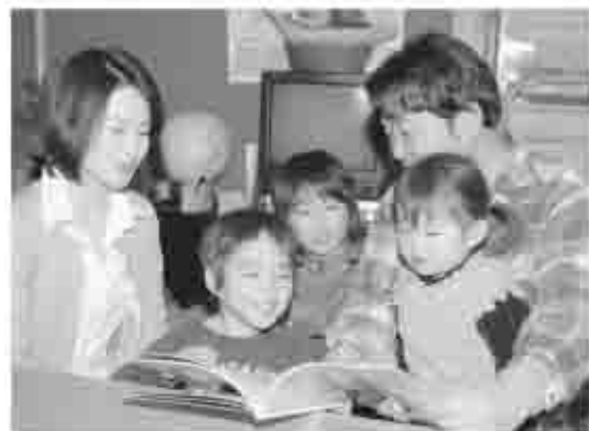
自分なりのやり方で

かんで暴投することや、反対に、投げたボールがなかなか返ってこないこともあるかもしれません。そんなとき、「親の気持ちに伝えてくれない」と感情をぶつけてしまっています。ドッチボールになってしまえば、キャッチボールは子どもの気持ちを上手に受け止め、親の思いを伝えるもの。どんなときでも、「愛情」という名の会話のやさしいボールを投げ、受け止め、