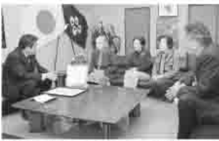
塩山生活学校のメンバーが受賞報告に訪れ、市長からますますの活躍を期待されました。

塩山生活学校は、設立当初より省資源・リサイクルを実践すると共に、市民への実態調査や啓発活動を通じて、地域への問題意識を喚起してきました。昨年度からは、廃油の分別回収運動