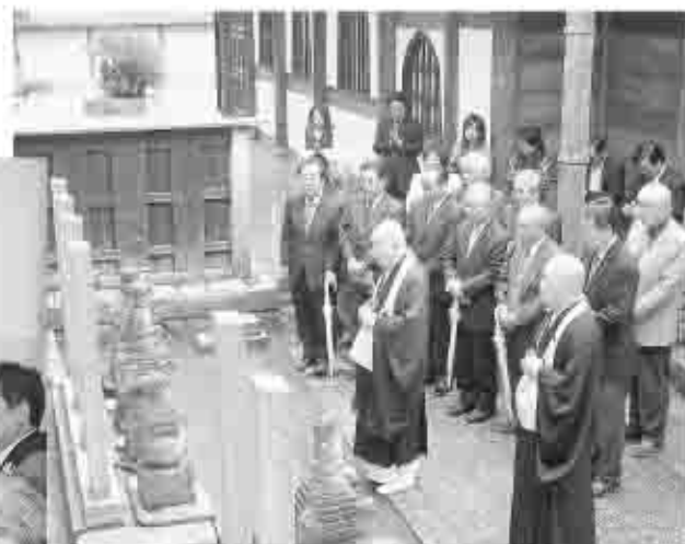
▲甲州市と関わりの深い妙心寺へ訪問し、参拝を行った。

▲市議会、商工会、観光連盟がキャラバン隊として京都市役所を10月に訪問。 今後、両市の観光情報を共有していくことなど、互いの観光発展をめざしていきます。