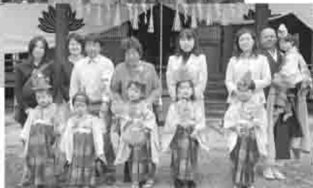
かわいいお稚児さんの姿で記念写真 (上) 信玄公忌でのお稚児さん (右) 秋葉祭でのお稚児さん