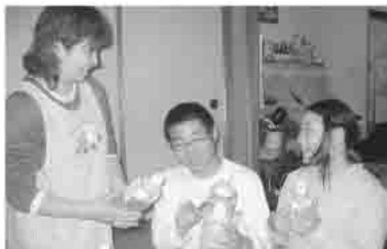
子どもから 教えられることも

活の中でも「社会のルール」と向き合っています。子ども達の将来を考え、正しい社会のルールを教えることは、私たち親にとつての義務です。まずは、子どもとの会話で日常生活からルールを守ることに話して話し合います。子ども達は、親の姿を見て育ちます。私たち大人が生活の中で率先して社会のルールを守り教えましょう。