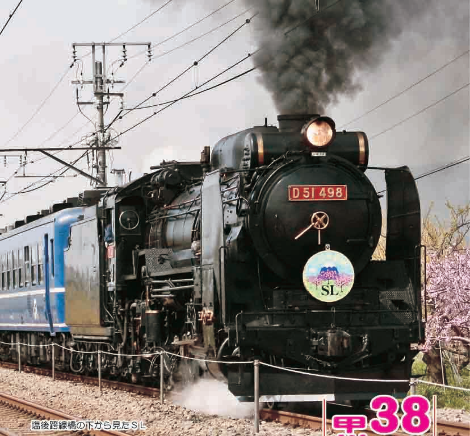
塩後跨線橋の下から見たSL