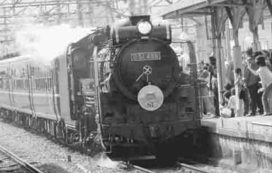
「すごいよ！」38年ぶりのSLは最高だよ！

運行期間中には、塩山駅をはじめとする甲州市内に、多くの観光客が訪れ、SLを見た人々からは、汽笛と煙に驚き、「カッコイイ」と沿線から大きな声が飛び交い、春の甲州市を満喫して、最高の思い出を作っていました。