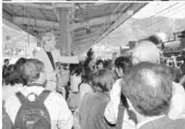
38年ぶりに見る人や、はじめて見る人など、みんながSLに感動していました。