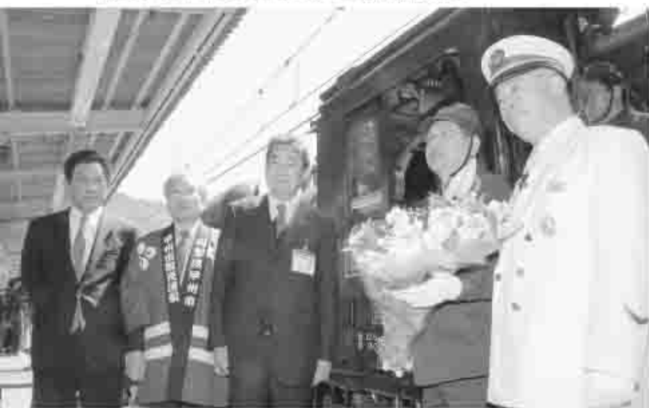
4月1日、田辺市長、竹川観光連盟会長などが運転士に「ようこそ甲州市へ」と花束を渡しました。