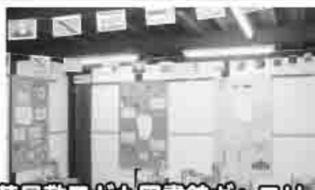
甘草屋敷子ども図書館ギャラリー展