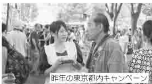
昨年の東京都内キャンペーン