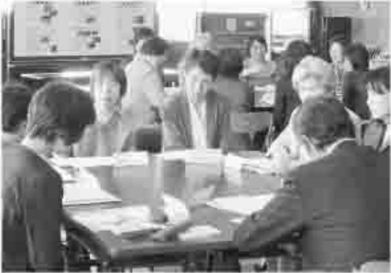
3つの部会に分かれ、推進委員のみなさんが、推進活動について熱心に話し合いを行いました。

ぜひ、推進委員の話しに耳を傾けてください。皆さんの「気づき」と「改善」により、甲州市のすべての人が尊重される、公平で住みよい男女共同参画社会が実現されます。