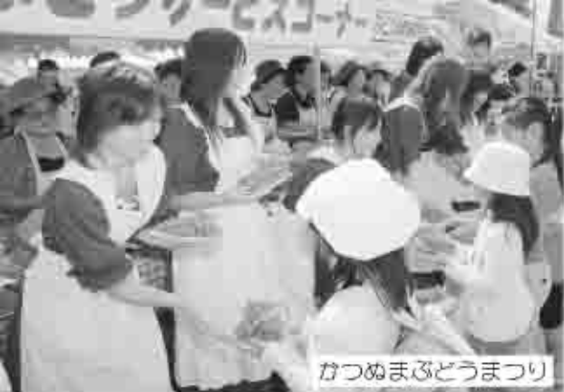
かつぬまぶどうまつり