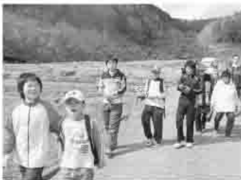
3月に行なわれた「さわやか歩け歩け大会」の様子です。115名が神金地区を歩きました。

この会は、地域ぐるみで健康づくりを進めていこうと、昭和58年に当時の区長さんをはじめ保健環境推進委員、婦人会等の代表者が、行政と連携して会を設立しました。会の活動の一環で、より多くの人に健診を受けてもらおうという取り組みは、とても素晴らしい