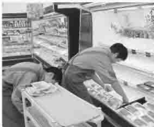
昨年のキャリア教育（中学生職場体験）