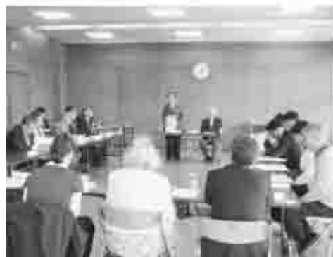
5月14日に第1回国際交流委員会を開催し、今後の国際交流について、貴重な意見交換を行いました。