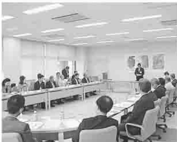
審議会で検討された目標都市構造図案

策定審議会は、これまでに二回開催され、第一回では「甲州市まちづくりの主要課題」が検討され、第二回では「都市づくりの目標」として「目標とする都市構造」を主要テーマに検討が進められました。 これまでの審議会では、今後のまちづくりに向けて出席委員から、「少子高齢化や将来の人口のあり方」「農業・観光・商業などの産業のあり方」「生活環境や交通条件」「環境や景観の保全」「市民意向を反映したまちづくり」「合併後の新市としての一体のまちづくり」などの問題について、議論が進められました。第二回審議会では、多岐にわたる問題点や課題を踏まえ、「具体的にどのようなまちづくりをめざすのか、また甲州市の都市構造をどのように考えるのか」を議題に検討が進められました。