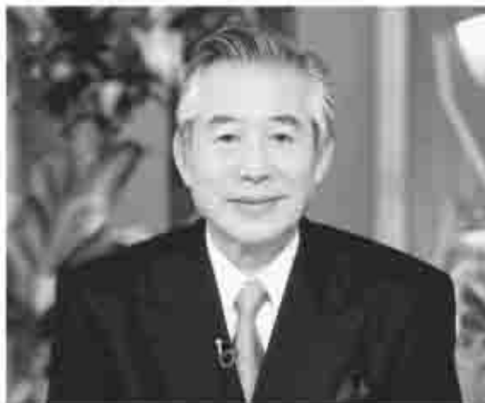
・司会者 児玉 清さん（俳優）