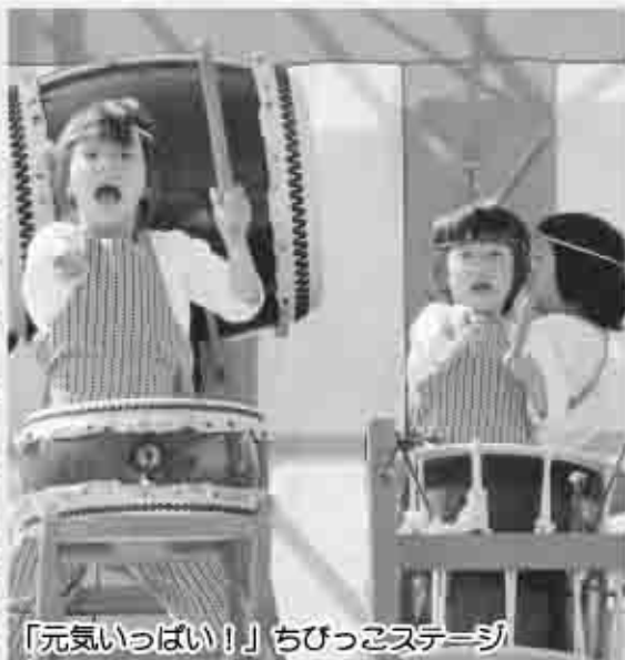
「元気いっぱい！」ちびっこステージ