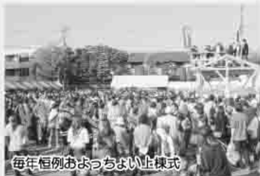
毎年恒例およっちょよ上棟式

10月19日に、甲州市商工会は旧シルク駐車場をメイン会場に、第3回甲州市およっちょよ祭を開催しました。当日はおよそ2万人を超える方々が訪れ、市民総参加の祭りを楽しんでいました。また同日、南小では地元産の食材を使った学校給食試食会も開催されました。