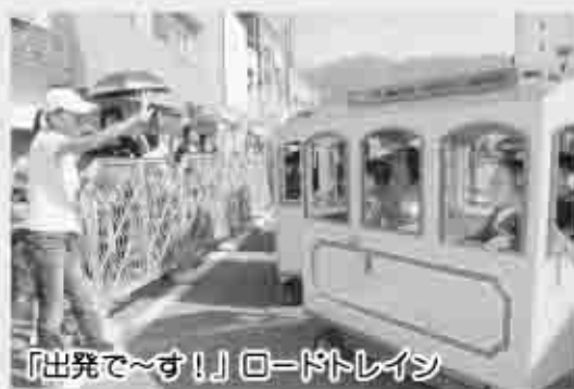
「出発で〜す！」ロードトレイン