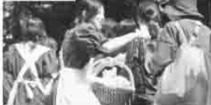
日比谷松本楼10 円カレーチャリ ティー (9月25日)