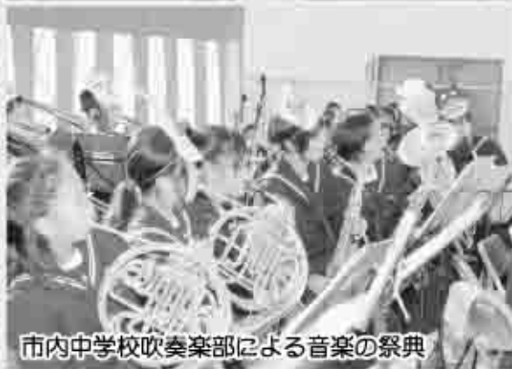
市内中学校吹奏楽部による音楽の祭典