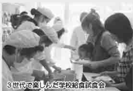
3世代で楽しんだ学校給食試食会