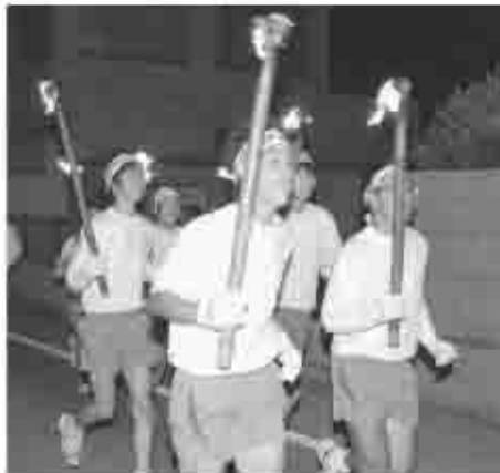
地域の願いを込めた炎を持って走る勝沼中学校の生徒

こうして、勝沼地域を回った炎は、人々の様々な思いや願いとともにぶどう祭りのメイン会場である中央公園へ集められ、そこから柏尾山へと向かい、夜空を焦がす鳥居焼の炎へと繋がります。