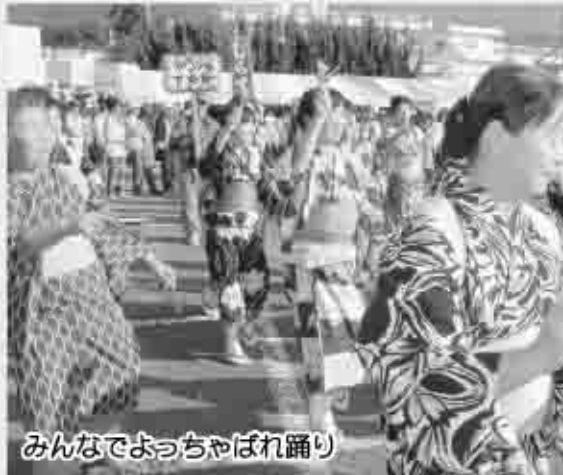
みんなでよっちょよばれ踊り