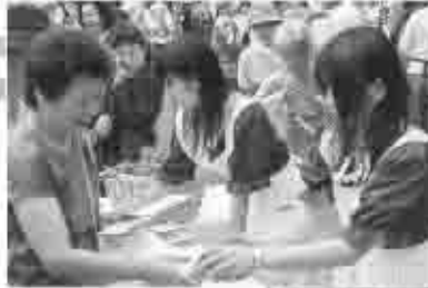
江東区民祭り (10月18日)

日比谷松本楼のキャンペーンでは、勝沼地域の会員から提供いただきました、甲州市特産ぶどう「甲斐路」を1500人に無料で配布をして『秋の甲州市へお出かけ下さい』とPR活動をしました。