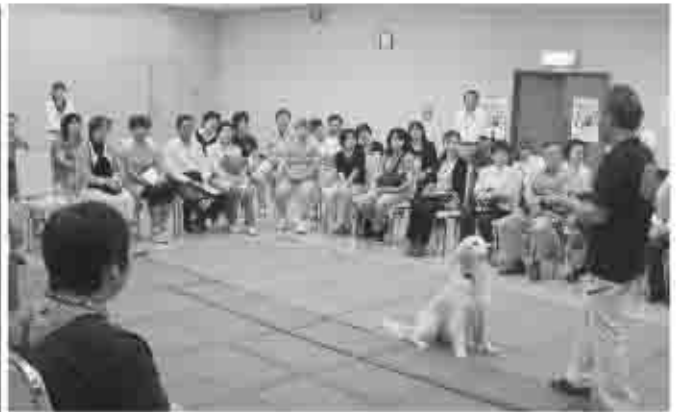
9月12日に甲州市民文化会館で開催された峡東保健所主催の「犬のしつけ教室」