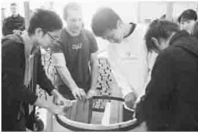
ワイン工場で、ワイン樽職人と一緒に樽作りを体験