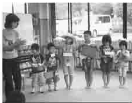
ティンカーベルおはなし会