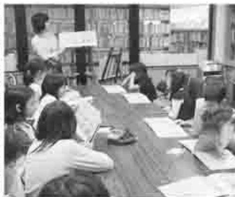
読書クラブ「カムカムクラブ」

「アニメ」はラテン語で「魂」を意味する言葉で、アニメーションは元来『いきいきした状態・活性化』のことを指します。子どもは誰でも素晴らしい読み手になる可能性をもっていますが、本を読む力は自然に育むものではありません。しかし、読書を強要したのではせっかくの本の楽しさが伝わりません。