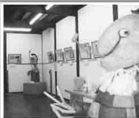
甘草屋敷子ども図書館にて開催！

子ども図書館企画展開催中！ おばけのくにへの招待 状〜ソウガ・イマムラ 絵本原画展〜