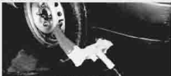
自動車の差押え例 (タイヤロックによる運行禁止措置)

また、場合によっては、職員が滞納者の自宅等を捜索して、発見した財産を差押え、搬出することも行います。