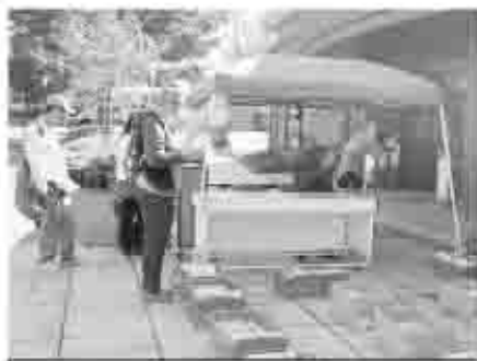
ブックリサイクル

秋晴れが広がる11月1日、図書館まつり「カムカムフェスタ2008」が勝沼図書館で開催されました。赤ちゃんからご年配の方まで、たくさんの方々に参加していただきました今年のフェスタ。盛りだくさんの内容をたっぷり楽しんで、みんなで笑顔いっぱい帰っていく姿が印象的でした。