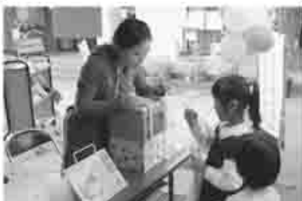
オリエンテーリングをしながら図書館の使い方を調べます。全問正解したらプレゼントくじがひけるよ♪