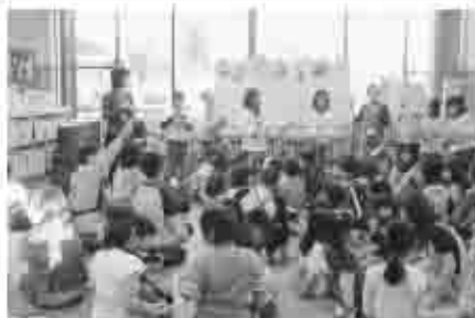
カムカムクラブの子どもたちが主体となって運営したビッグアニメーションと図書クイズ。