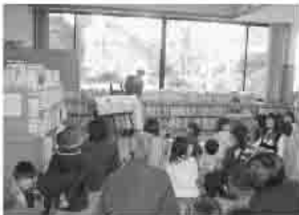
ボランティア「ティンカーベル」のお話会