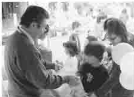
本を借りると、くじが一回ひけるんです♪