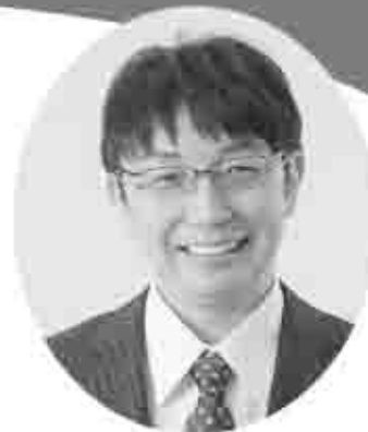
講師：木下博勝 きのしたひろかつ

■略歴 東京大学大学院医学博士課程修了 (医学博士) 2004年7月に女子プロレス界の女帝 「ジャガー横田」と結婚。現在は、本業 である医師の傍ら、文化人としてテレビ 等多方面で活躍している。 ■著書 ボクに宇宙一の幸せをくれたジャガー ～ボクらの出産顛末記～ (日本テレビ出版) ■連載 デイリースポーツ毎週木曜日 (朝刊・夕刊) コラム「健康よもやま話」連載中