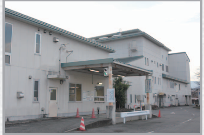
令和3年度に解体工事を実施予定の甲州市環境センターごみ処理場。12月定例会に補正予算案を計上