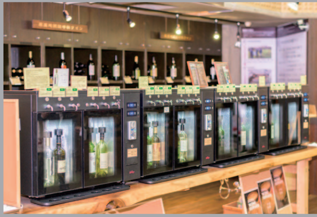
「やまなしグリーン・ゾーン認証施設」の適用を受けた勝沼ぶどうの丘。新型コロナウイルス感染症対策として電動ワインサーバーを活用