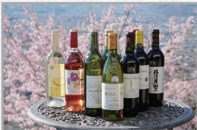
魅力ある返礼品を用意し、甲州市をPR

今後も魅力ある返礼品を用意するなど、ふるさと納税の趣旨に合った健全な形でふるさと納税寄附の充実を図っていききたいと考えております。