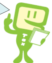
e-Taxキャラクター イータ君

東京地方税理士会甲府支部はね、税務に関する専門家として、独立した公正な立場で納税者の信頼にこたえ、国民の三大義務の一つである「納税義務」の適正な実現を図るため活動している税理士の団体なんだよ。