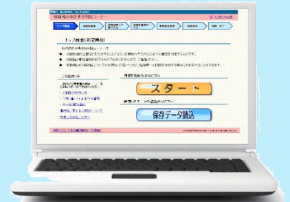
「相続税の要否判定コーナー」のトップ画面

◎「相続税の申告要否判定コーナー」の入力で困った時は・・・ 「相続税の申告要否判定コーナー」の以下を参照してください ・「入力例・FAQ等」…事例に基づく入力例やよくある質問 ・「当画面の入力例」…各画面における具体的な入力例