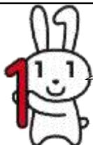
マイナンバーキャラクター マイナちゃん