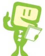
e-Taxキャラクター イータ君

山梨県酒造組合山梨支部はね、酒税の円滑な納税を促進し、酒類業界の安定と健全な進歩発展のために必要な事業を行い、自主的かつ自由公正な事業活動の振興を期するとともに、酒税の保身に協力している団体なんだよ。