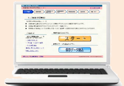
「相続税の要否判定コーナー」のトップ画面