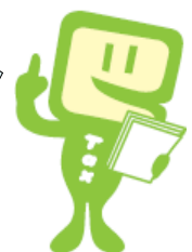
e-Taxキャラクター イータ君

山梨県卸酒販組合山梨支部はね、組合員の緊密な連絡親和と相互扶助の精神に基づき、酒税の円滑な納税を促進し、酒類業界の安定と健全な進歩発展のため必要な事業を行い、組合員の自主的且つ自由公正な事業活動の振興を期し、酒税の保全に協力し共同の利益の増進を図ることを目的としている団体なんだよ。