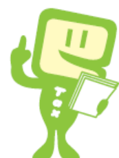
e-Taxキャラクター イータ君

山梨県酒造組合山梨支部はね、酒税の円滑な納税を促進し、酒類業界の安定と健全な進歩発展のために必要な事業を行い、自主的かつ自由公正な事業活動の振興を期するとともに、酒税の保身に協力している団体なんだよ。