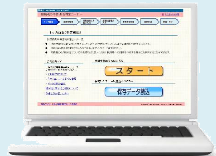
「相続税の要否判定コーナー」のトップ画面