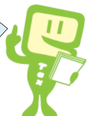
e-Taxキャラクター イータ君

山梨ワイナリー協会はね、ワイナリーの皆さんの緊密な連絡懇和と相互扶助の精神に基づき酒類の円滑な納税を促進し、酒類業の健全な進歩発展に寄与することを目的としている団体なんだよ。