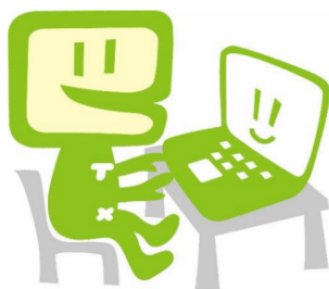
国税庁e-Taxキャラクター：イータ君